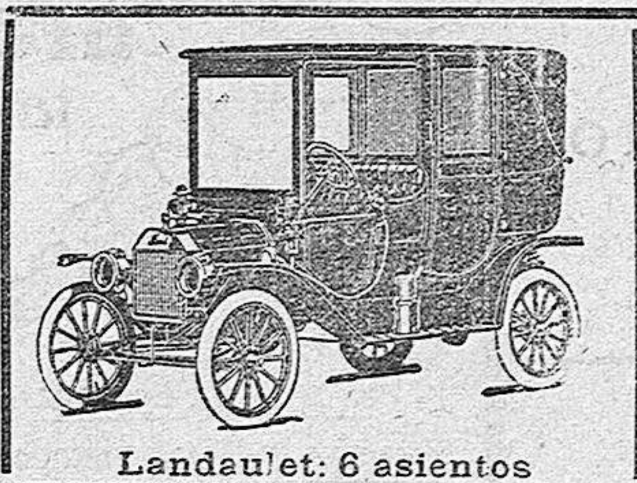
Landaulet: 6 asientos