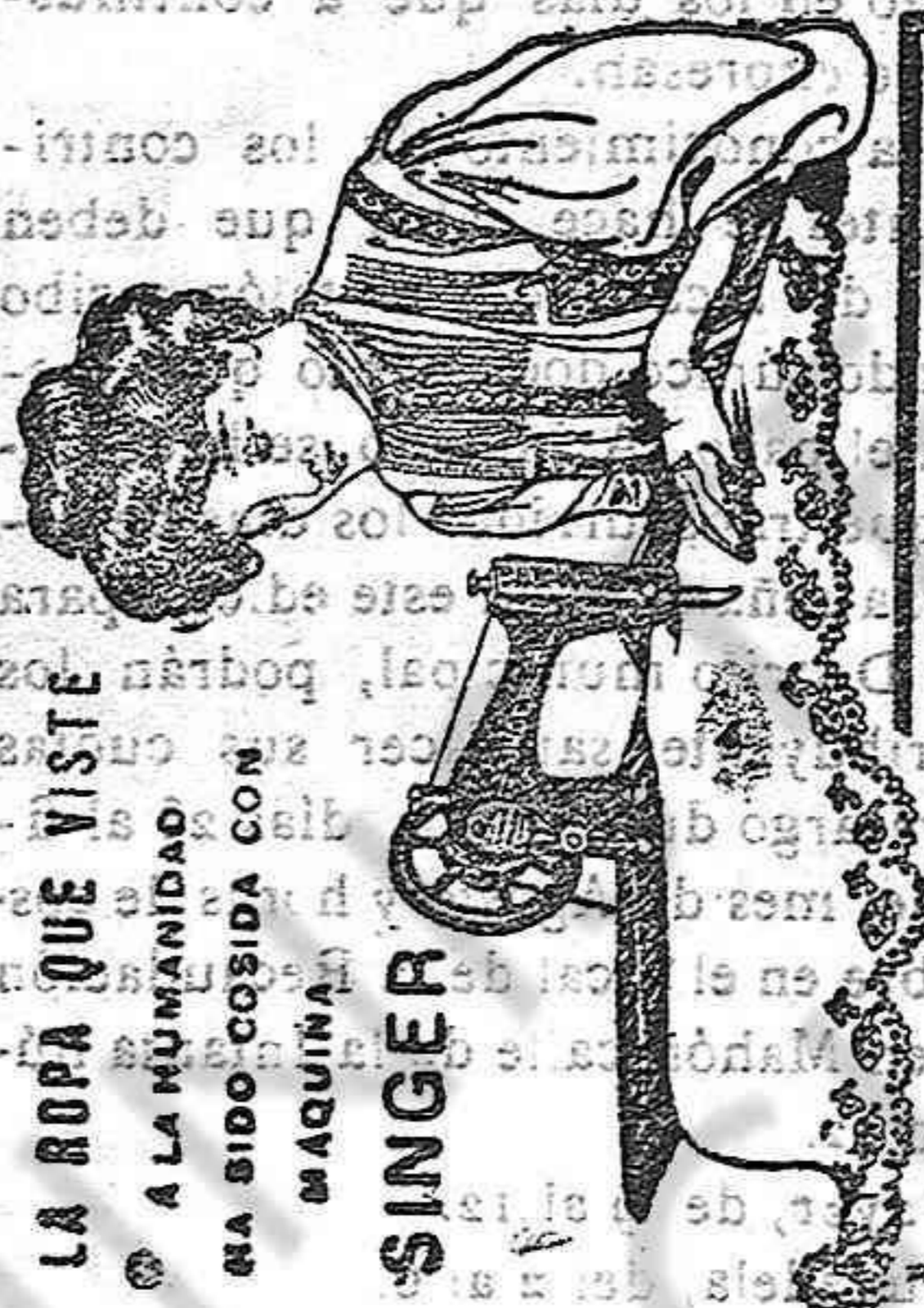
LA ROPA QUE VISTE A LA HUMANIDAD HA SIDO COSIDA CON MAQUINA SINGER