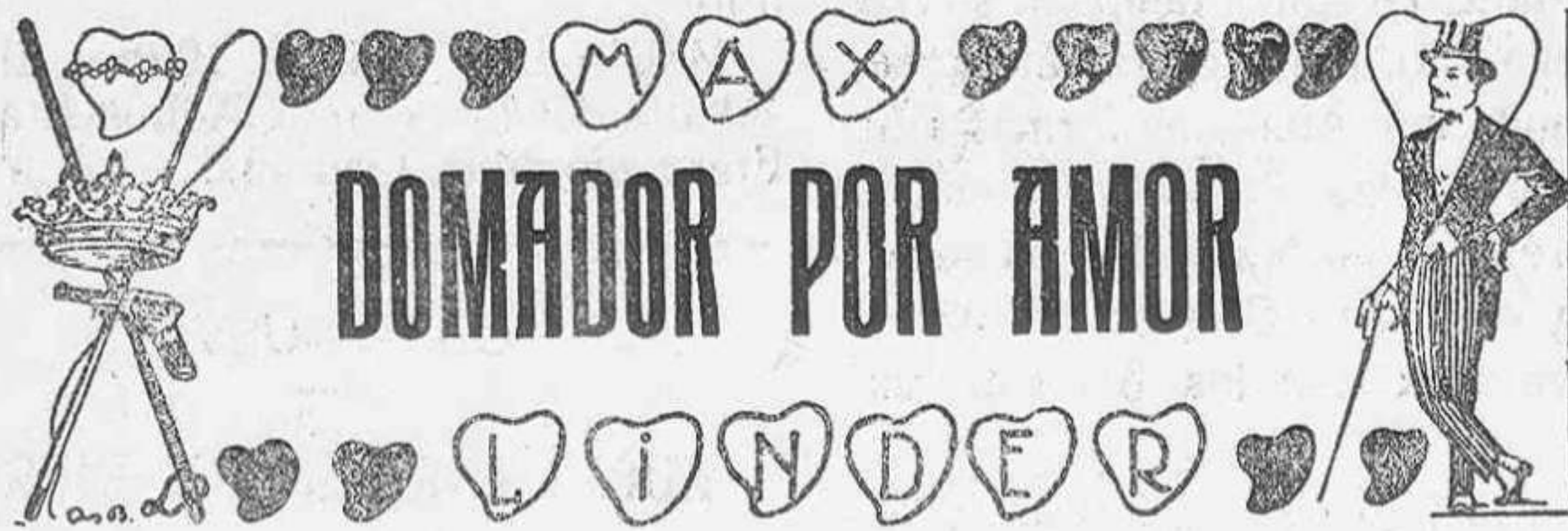
Interpretada por el REY DE LA RISA, el popular cómico francés MAX LINDER

Hoy sábado, a las 9 y media y mañana, domingo, a las 6 y media y a las 9 y media. El grandioso éxito de la sugestiva película en 5 partes, de lujosa presentación,