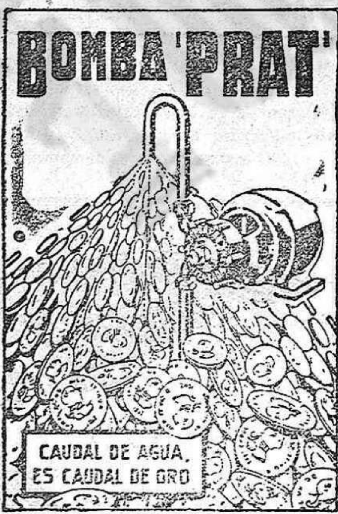
CAUDAL DE AGUA ES CAUDAL DE ORO

AGUA A COMODIDAD, SIN DESGASTES NI INTERRUPCIONES, Y CON UN CONSUMO DE FLUIDO INSIGNIFICANTE