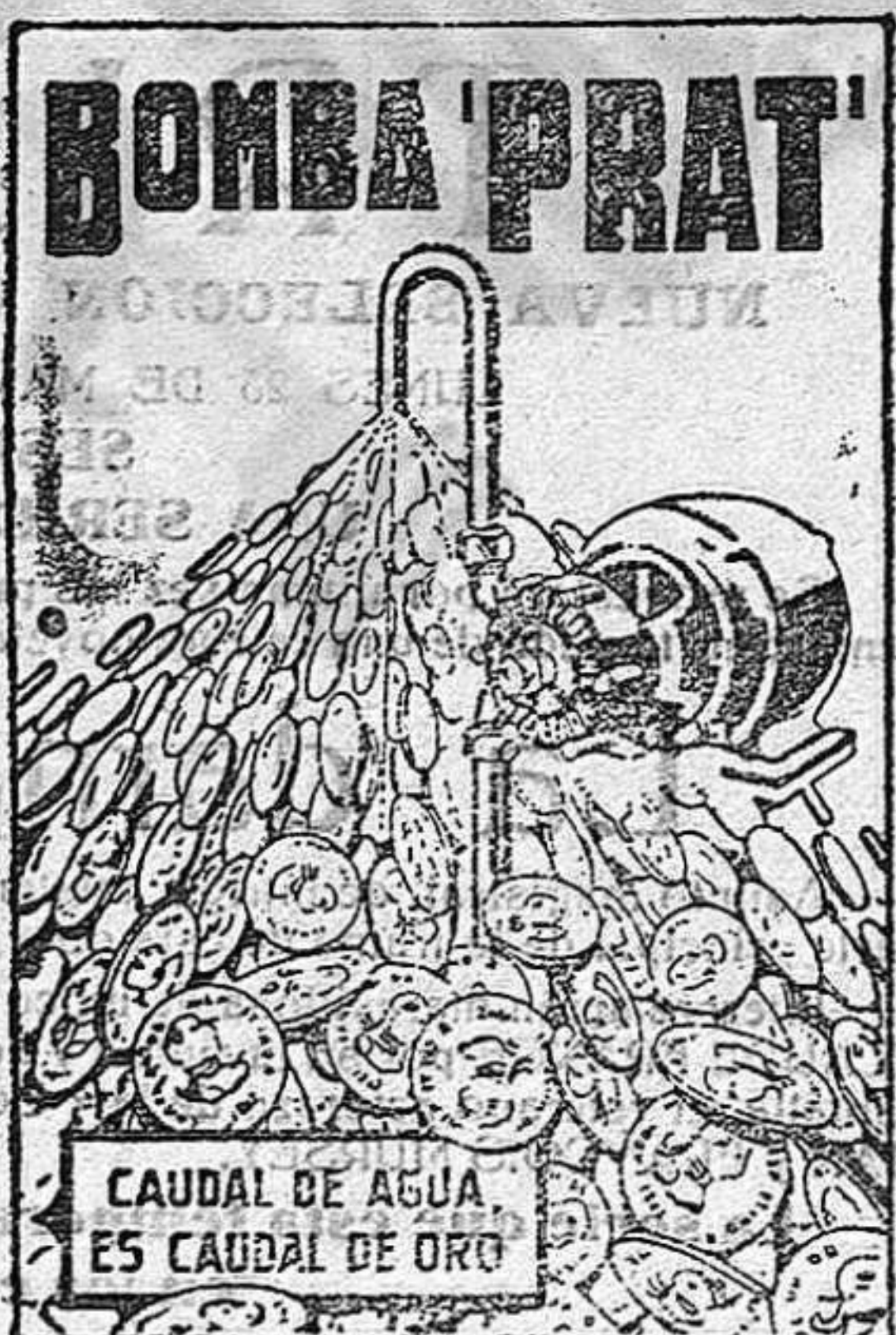
CAUDAL DE AGUA ES CAUDAL DE ORO

AGUA A COMODIDAD, SIN GASTES NI INTERERUPCIONES, Y CON UN CONSUMO DE FLUIDO INSIGNIFICANTE