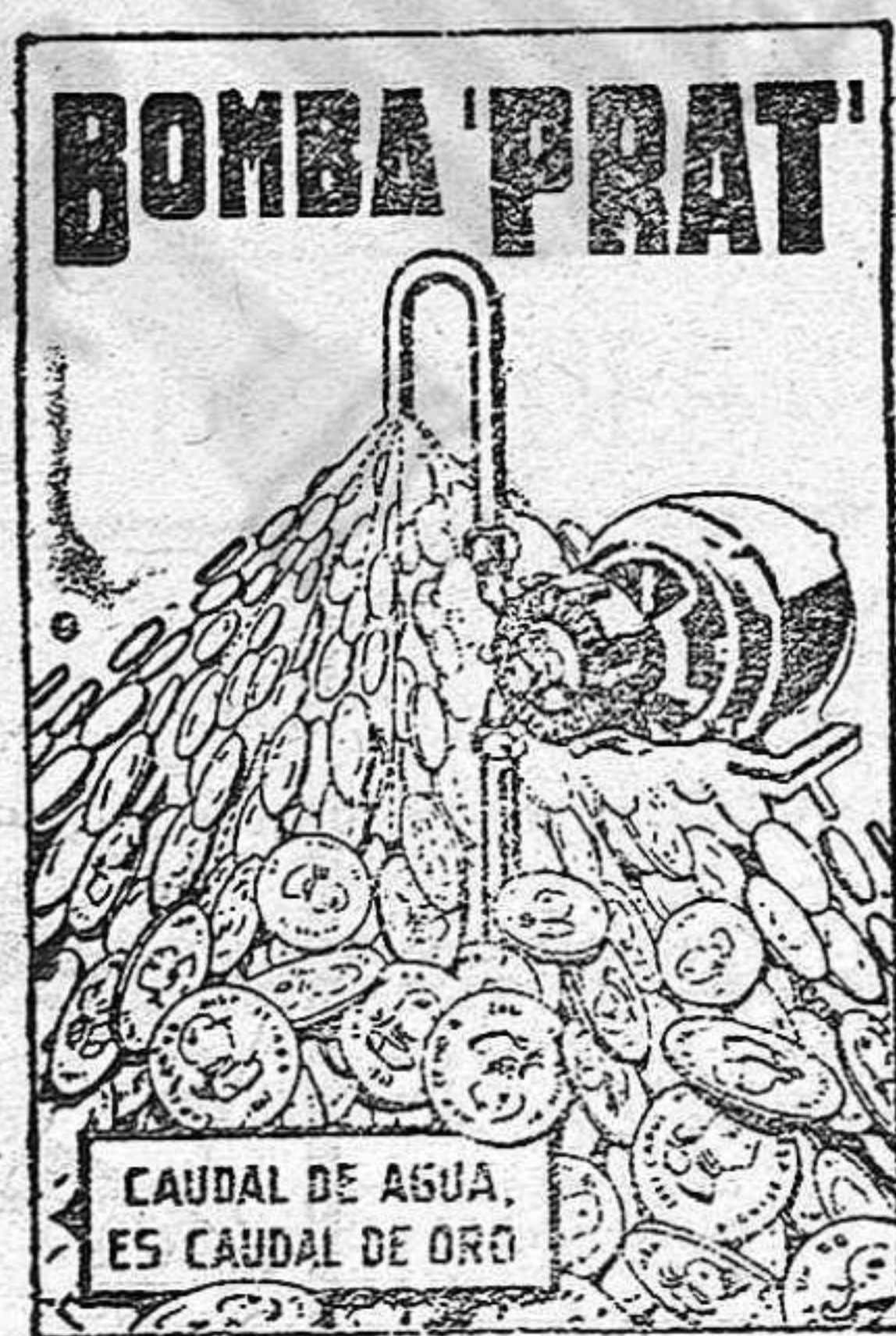
CAUDAL DE AGUA, ES CAUDAL DE ORO

AGUA A COMODIDAD, SIN GASTES NI INTERRUPCIONES, Y CON UN CONSUMO DE FLUIDO INSIGNIFICANTE