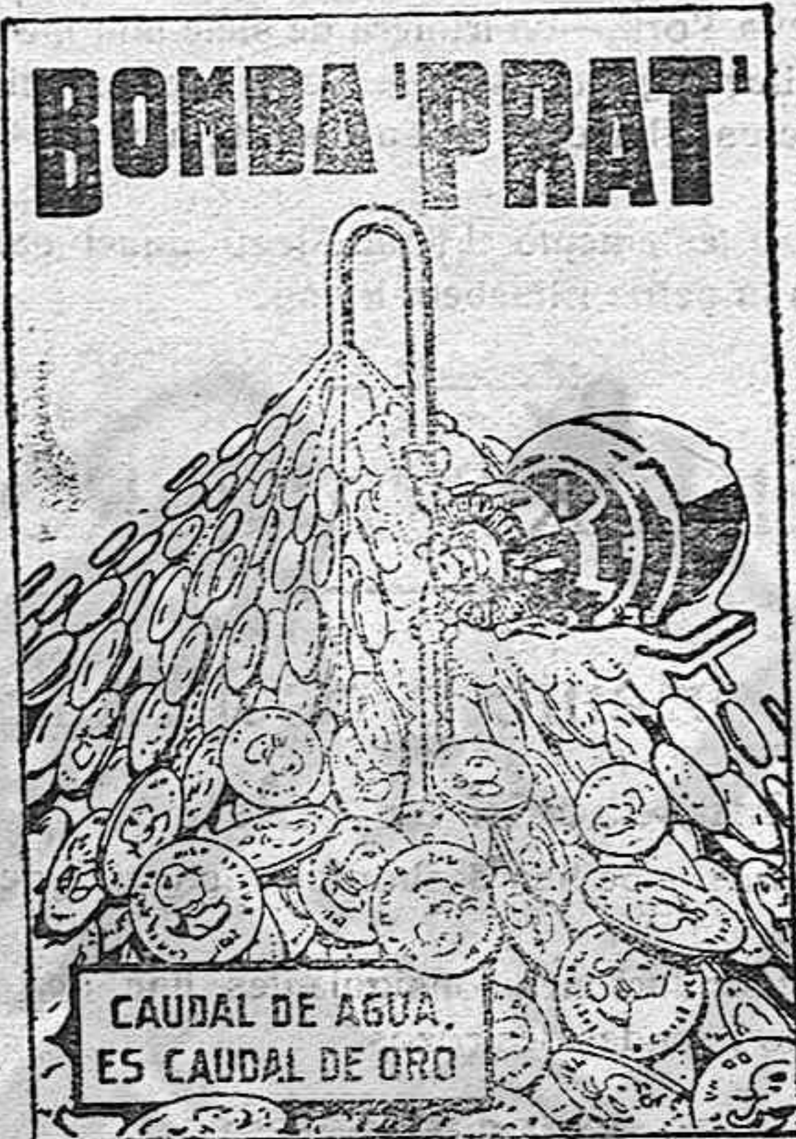
CAUDAL DE AGUA ES CAUDAL DE ORO

AGUA A COMODIDAD, SIN DESGASTES NI INTERRUPCIONES, Y CON UN CONSUMO DE FLUIDO INSIGNIFICANTE