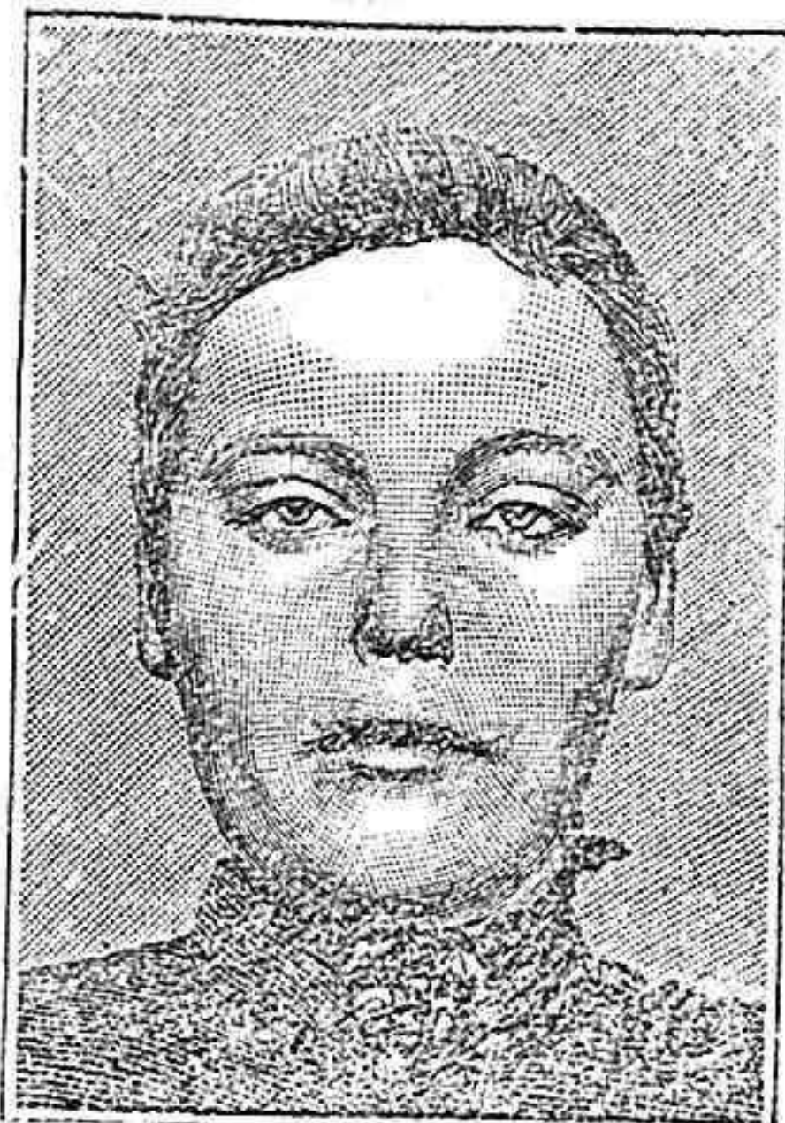
Después de 15 días de curación