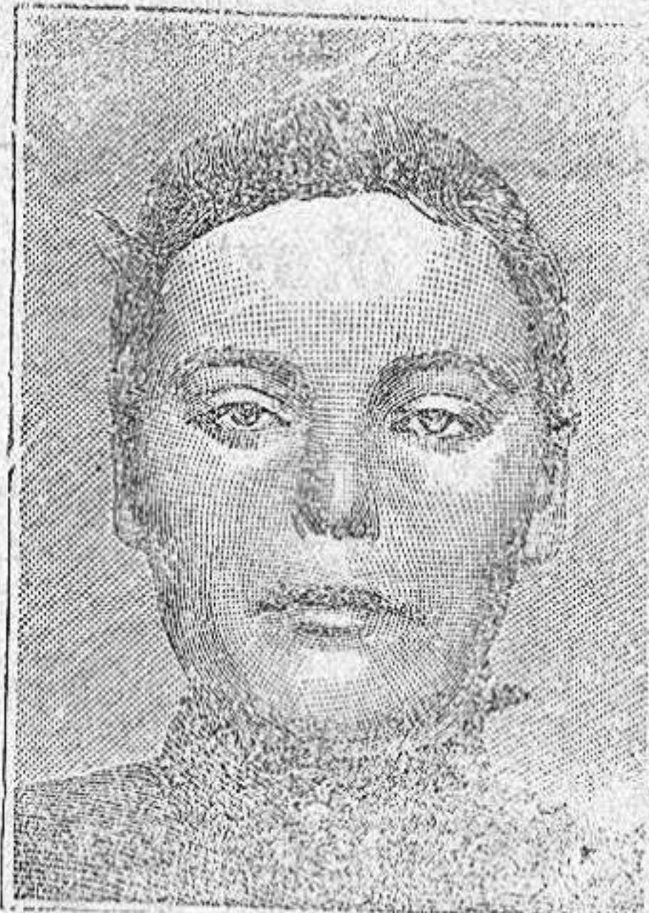
Después de 15 días de la curación