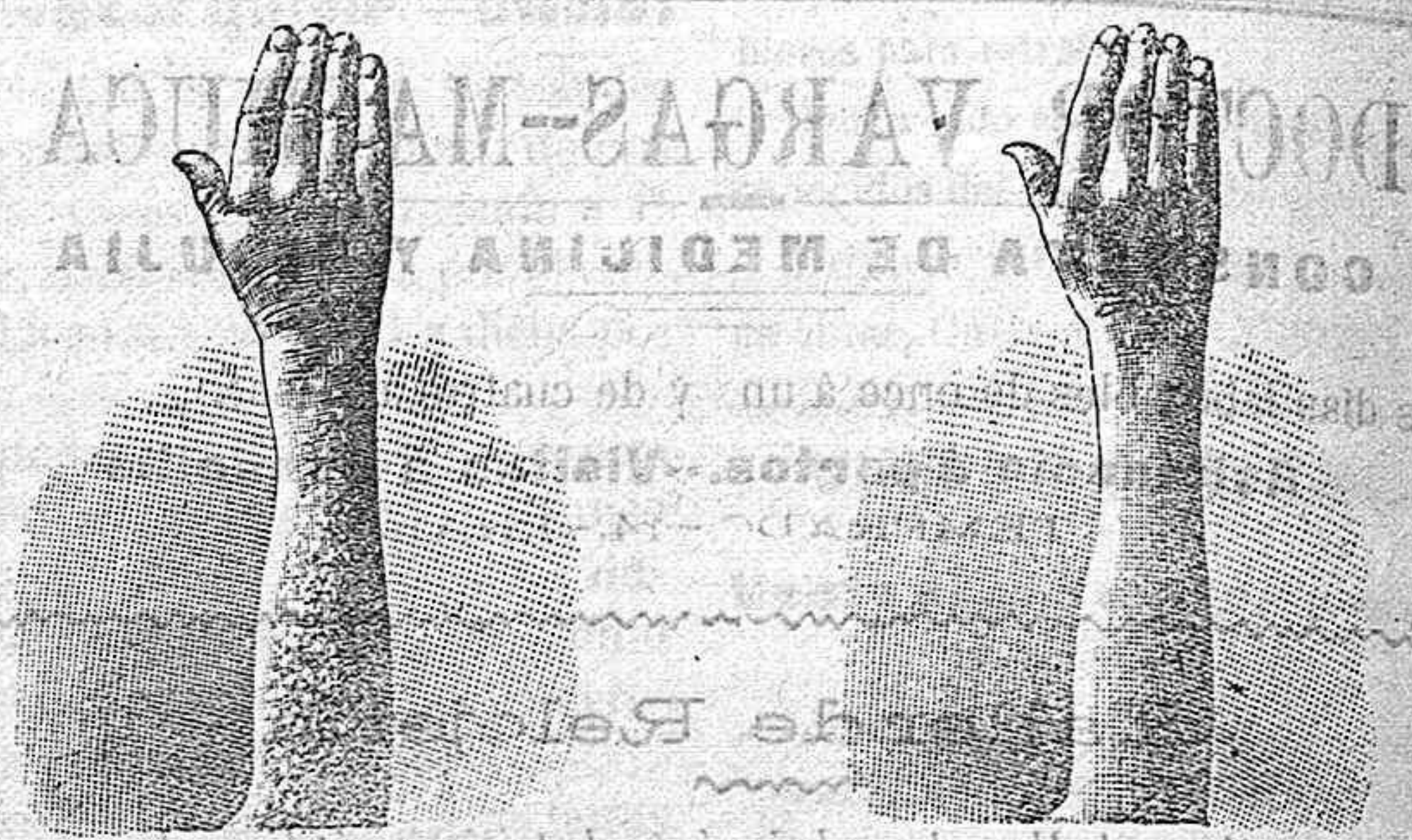
Antes de la curación Después de 70 días de curación

curación radical de todas las enfermedades de la piel y laspias nas y del artrismo, reumatismo, gota, dolores etc. por medio del TRATAMIENTO DEL RICHELET