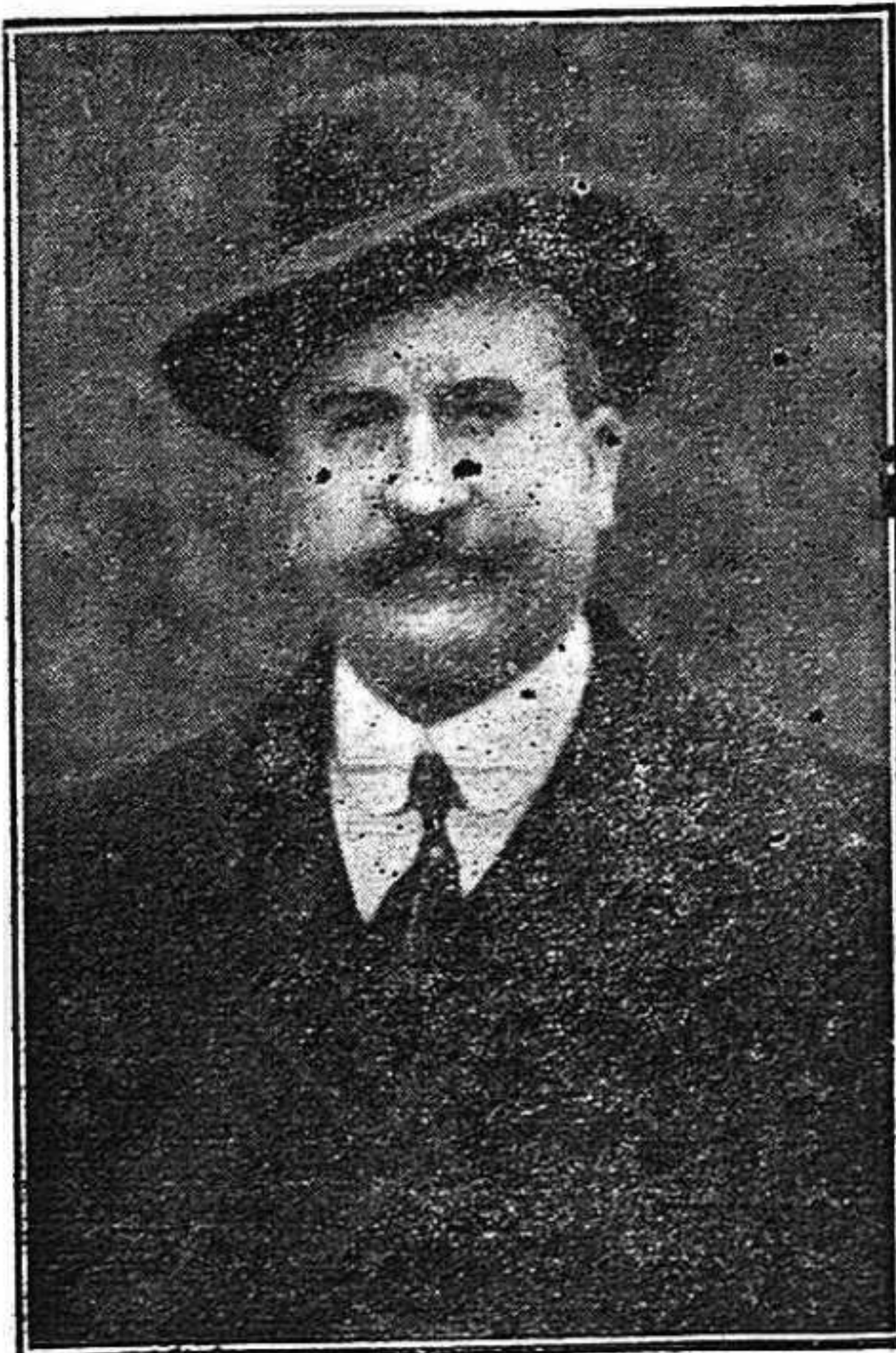
Jefe del partido republicano cuya carta referente a Unamuno, publicamos en otro lugar

a través de la historia, y en ella encontrarán la forma de tratar y resolver el mencionado problema que, al parecer, encuentran algunos tan difícil.