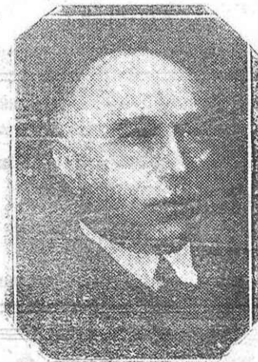
Don José Pedregal, que ha sido nombrado presidente del Consejo de Estado por el Gobierno provisional de la República.