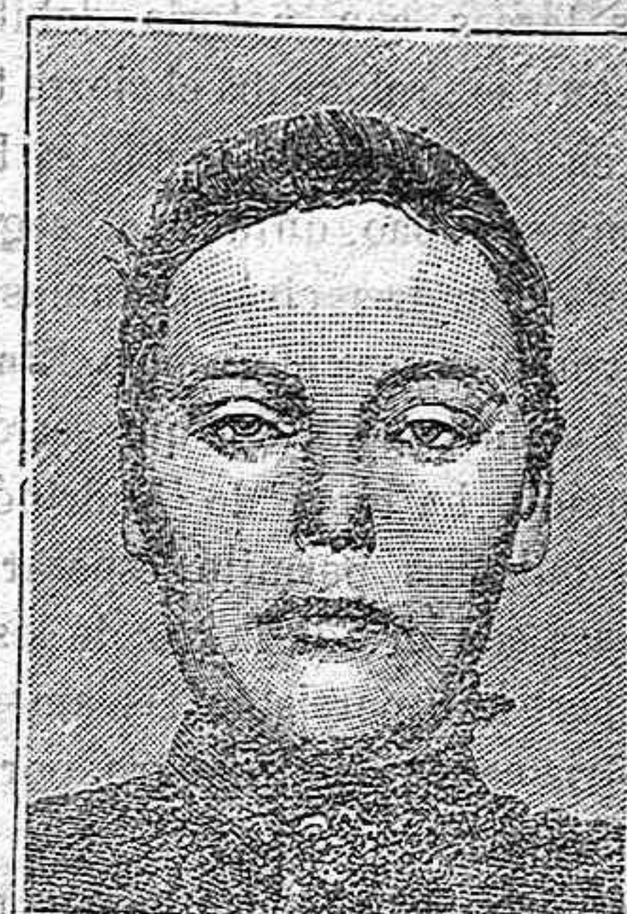
Después de 10 días de curación