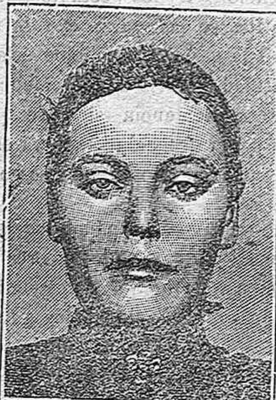
Después de 6 días de curación