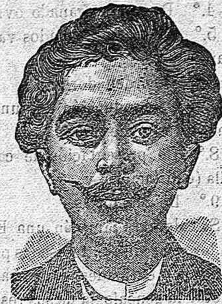
Después de la curación