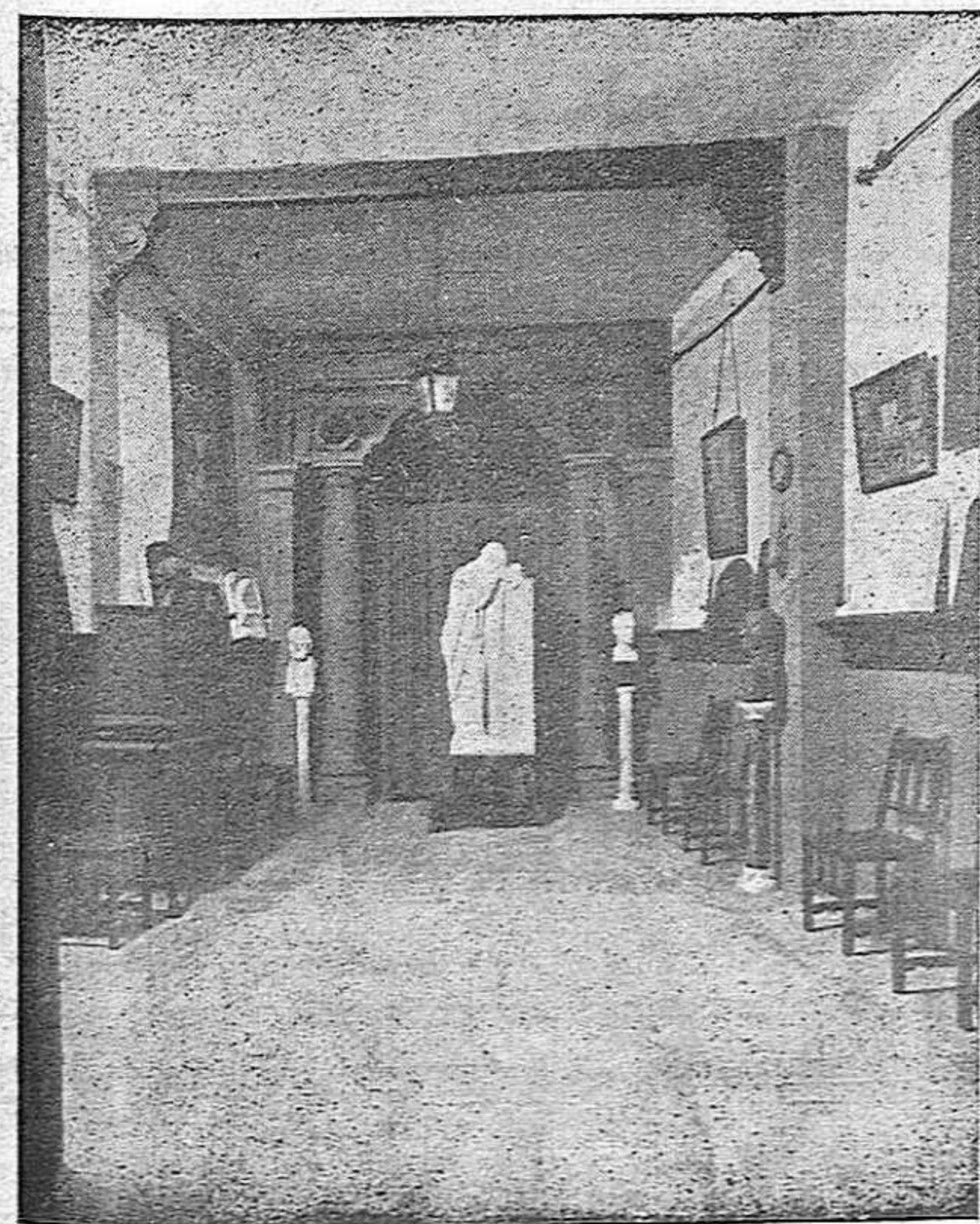
VALENCIA.—Vista parcial del salón de exposición que conduce a los grandes talleres de mármoles plásticos de los señores Víctor-Hino y F. Ferrando.