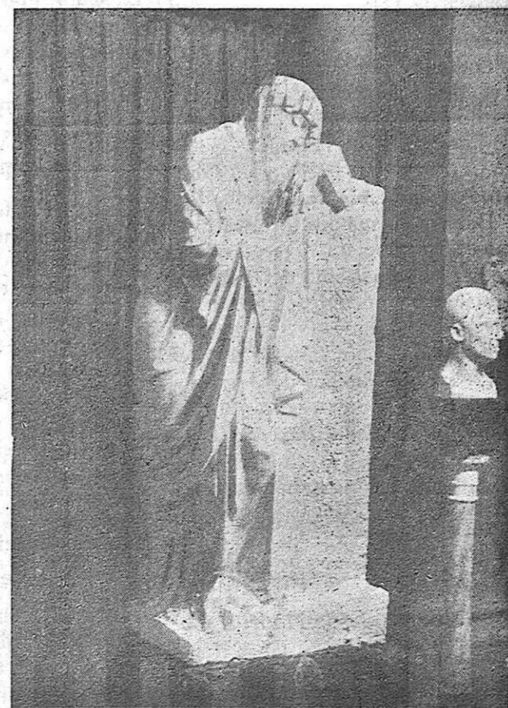
EXPOSICIÓN.—Una de las artísticas esculturas de que estará constituido el notable monumento funerario de la Familia Tarazona.