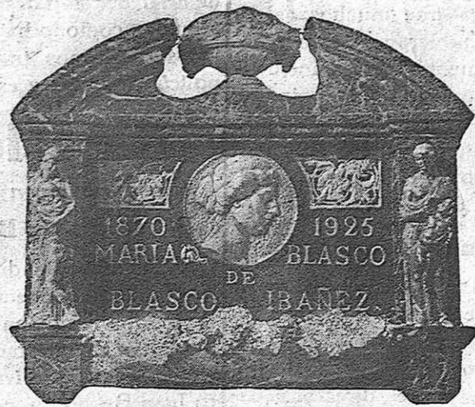
VALENCIA.—Bellísima lápida de mármoles de colores e incrustaciones de bronce, de la esposa del gran novelista Blasco Ibáñez.

Ferrando, el excelente pintor, cuya tendencia luminosa y la transparencia y colorido tienen el clasicismo de una escuela propia y definida, no es el artista acomodaticio y logrero y por eso sus cuadros, mausoleos y panteones tienen un valor de originalidad admirable. No hace mucho tiempo, celebró en el teatro Olympia de Valencia, una brillante exposición de pinturas y la Prensa y la crítica se mostraron unánimes en reconocer que Ferrando es uno de los pocos artistas que hacen sentir y pensar con la concepción y sobriedad de su su técnica armoniosa. Su actividad muéstrase en el catálogo de sus obras que no podemos hoy reseñar una a una. Ahí están, para testimoniarlo, el monumental panteón de don A. Ferrer Peset, con esculturas de J. Capuz, J. Vicente, R. Bargues y Víctor-Hino; el de don Aurelio Cánovas, con