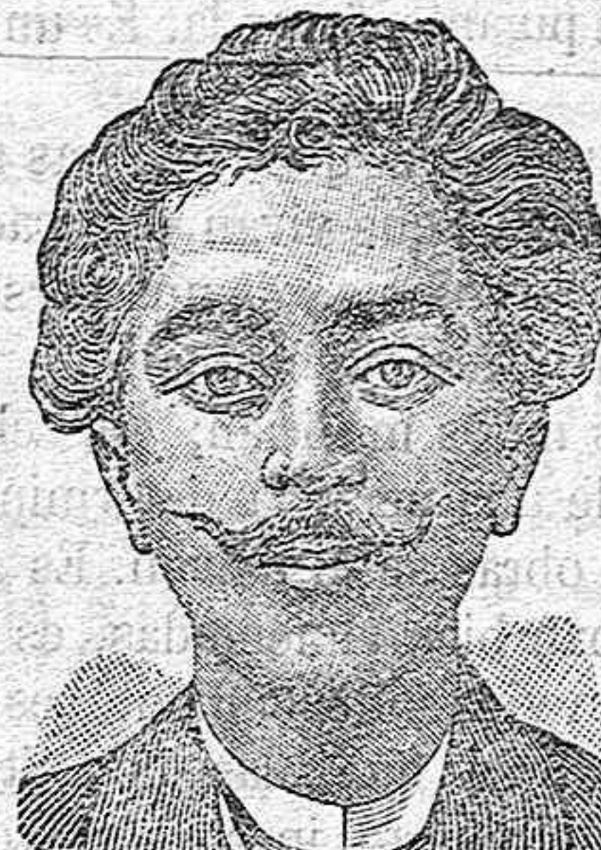
Después de 10 días de curación