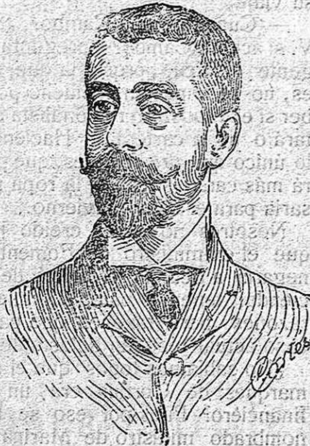
Don Cesar Silió Ministro de Instrucción Pública