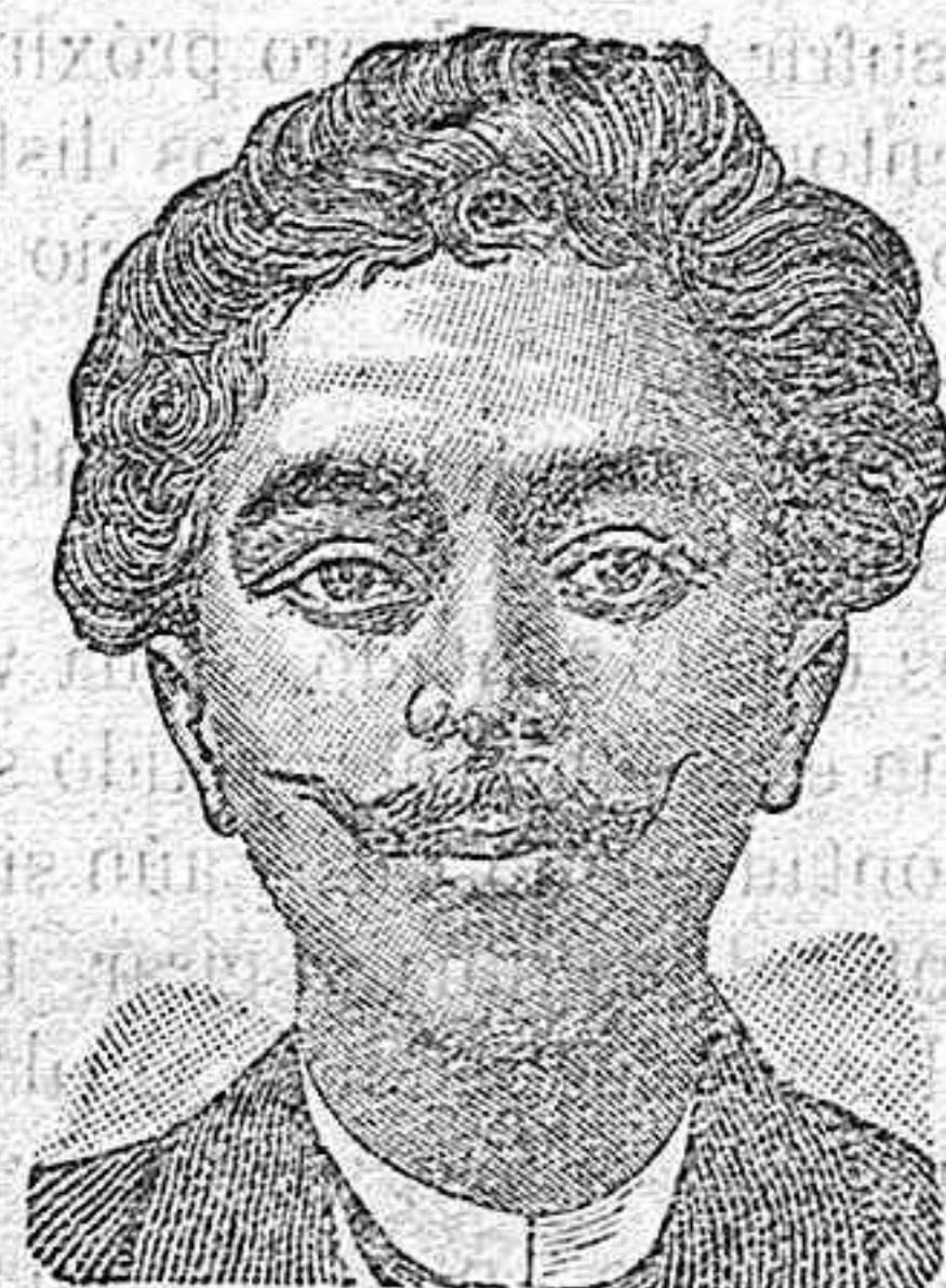
Después de la cura