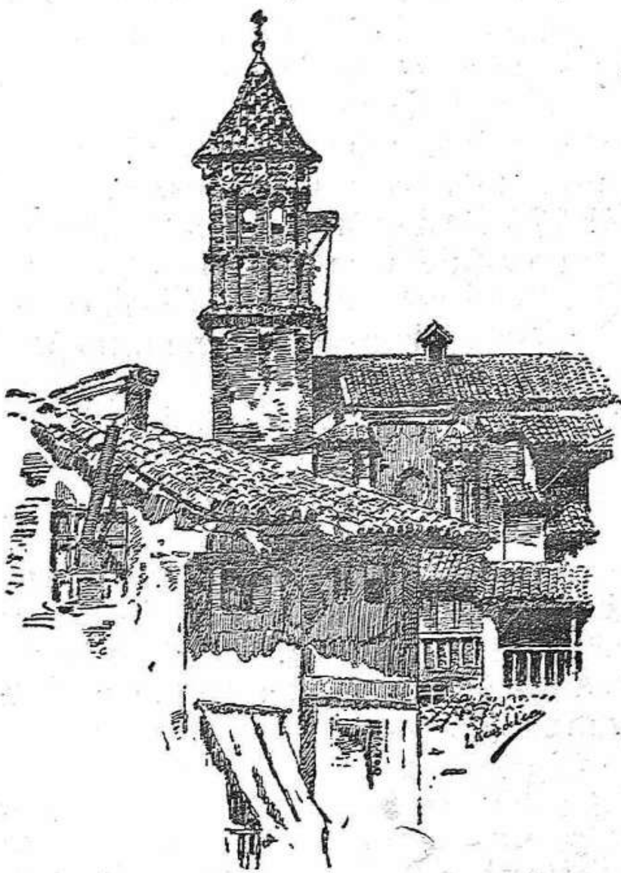
TORRE DE LA IGLESIA DE SAN PEDRO

La histórica iglesia que guarda las momias de los celebrados Amantes de Teruel, es sin duda alguna de las más antiguas de la ciudad, pues consta que fué construida inmediatamente despues de reconquistada por Alfonso II de Aragón, en 1171, y pocos años más tarde, ó sea en 1217, ya fué teatro de la escena de la