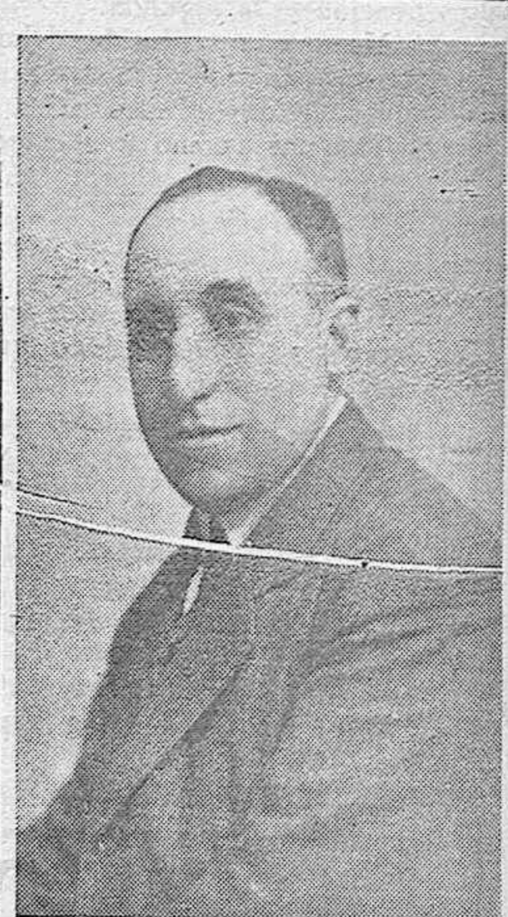
Don Fermín González de Sarralde Alcalde de Vitoria

Libretas de ahorro al 3'75 por 100 Imposición á un año, al 4'25.