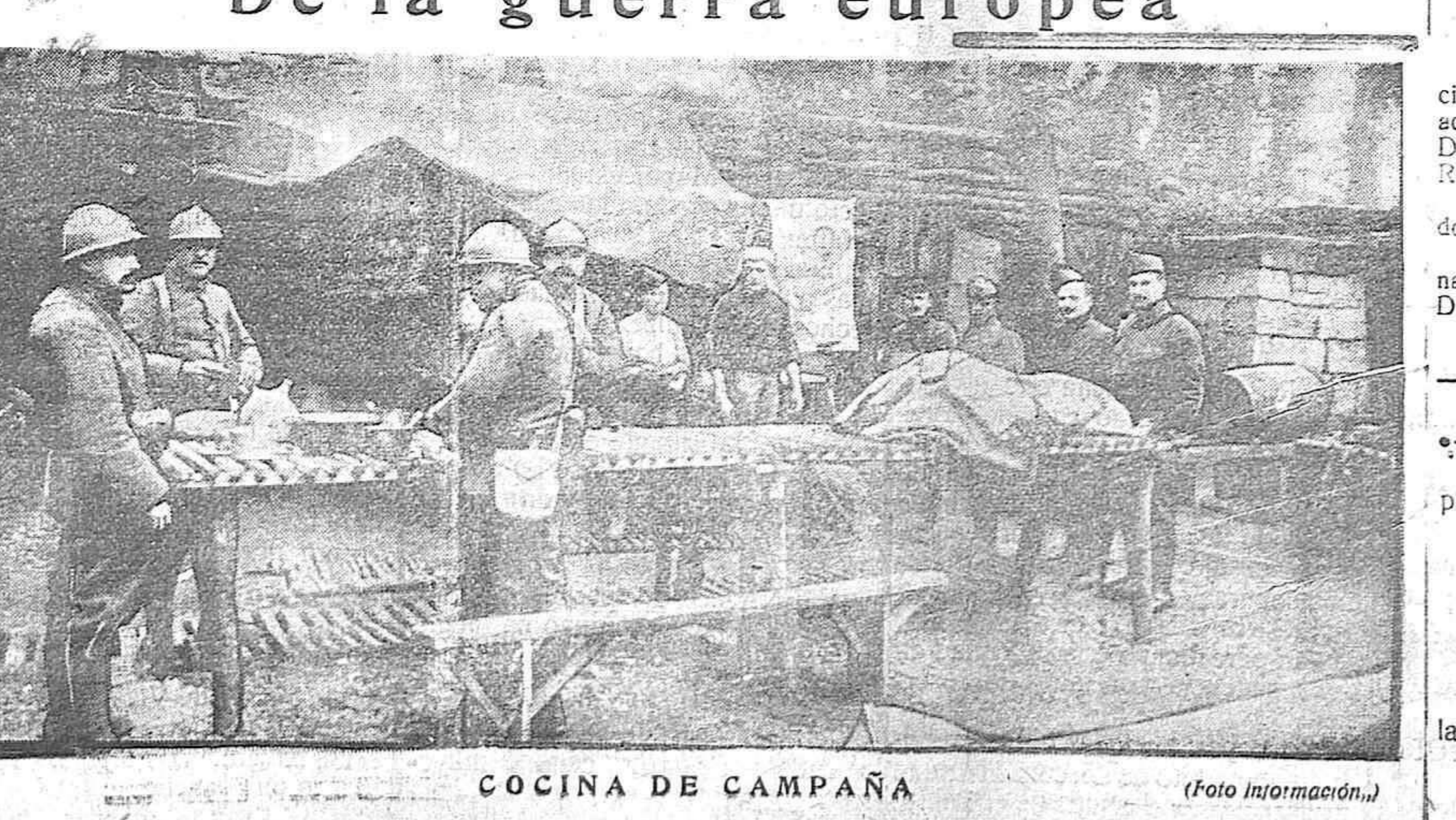
COCINA DE CAMPAÑA

S. M. el Rey (q. D. g.) se ha servido resolver de conformidad con lo pro-