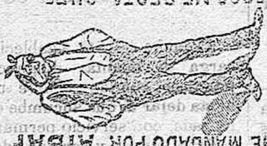
HE MANDADO POR AIRAL

pone al hombre, cual le veis, desfigurado, triste, meditando y llorando. La causa de todos estos males se destruye en UN MINUTO Y SIN RIESGO ALGUNO usando el