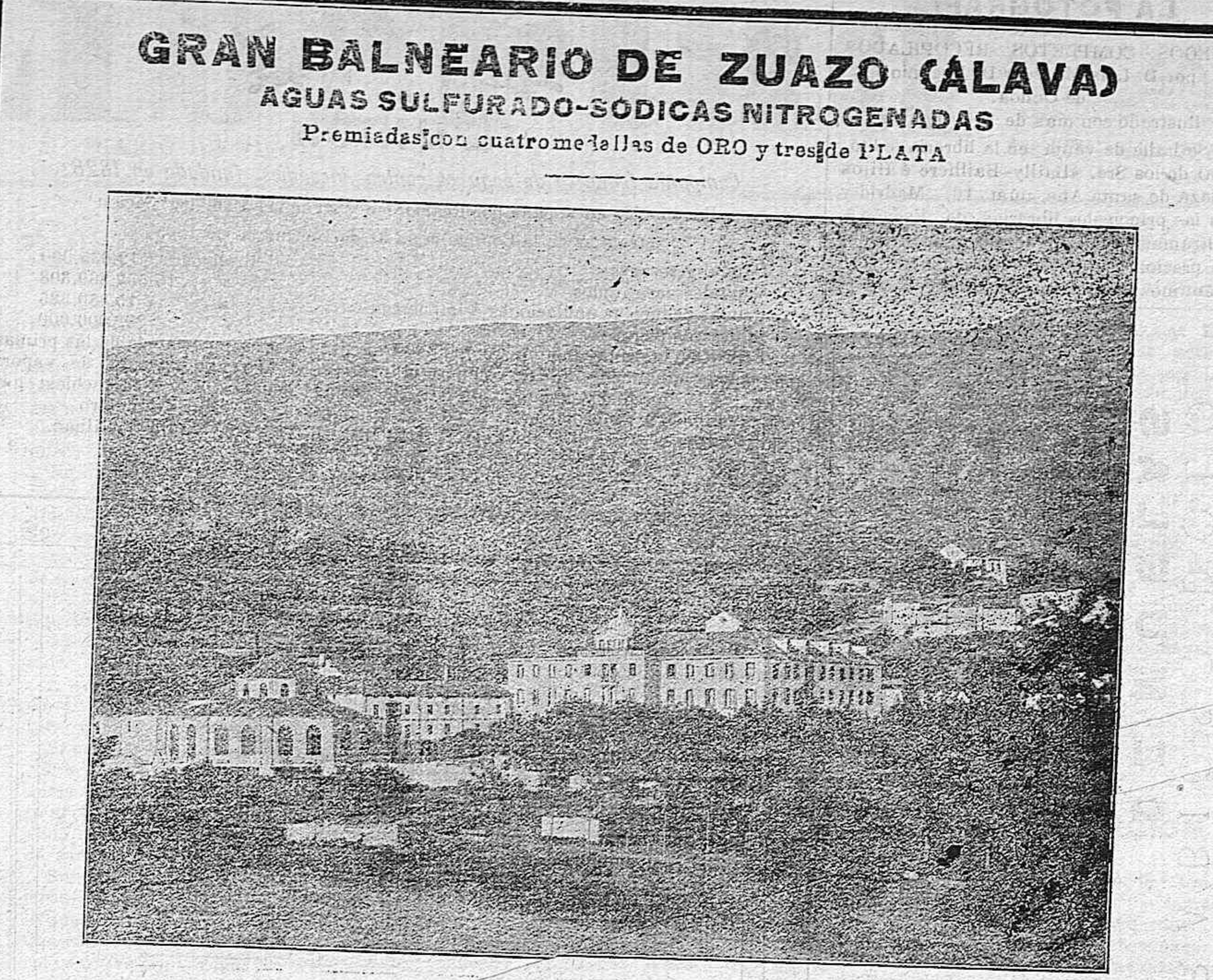
TEMPORADA OFICIAL DEL 15 DE JUNIO AL 15 DE SEPTIEMBRE. Pedidos de aguas y habitaciones al Sr. Administrador del Establecimiento

PAJA. de residuos de la fabricacion de fundas, se vende a 0'20 céntimos arroba fábrica de Betoño. 10-8