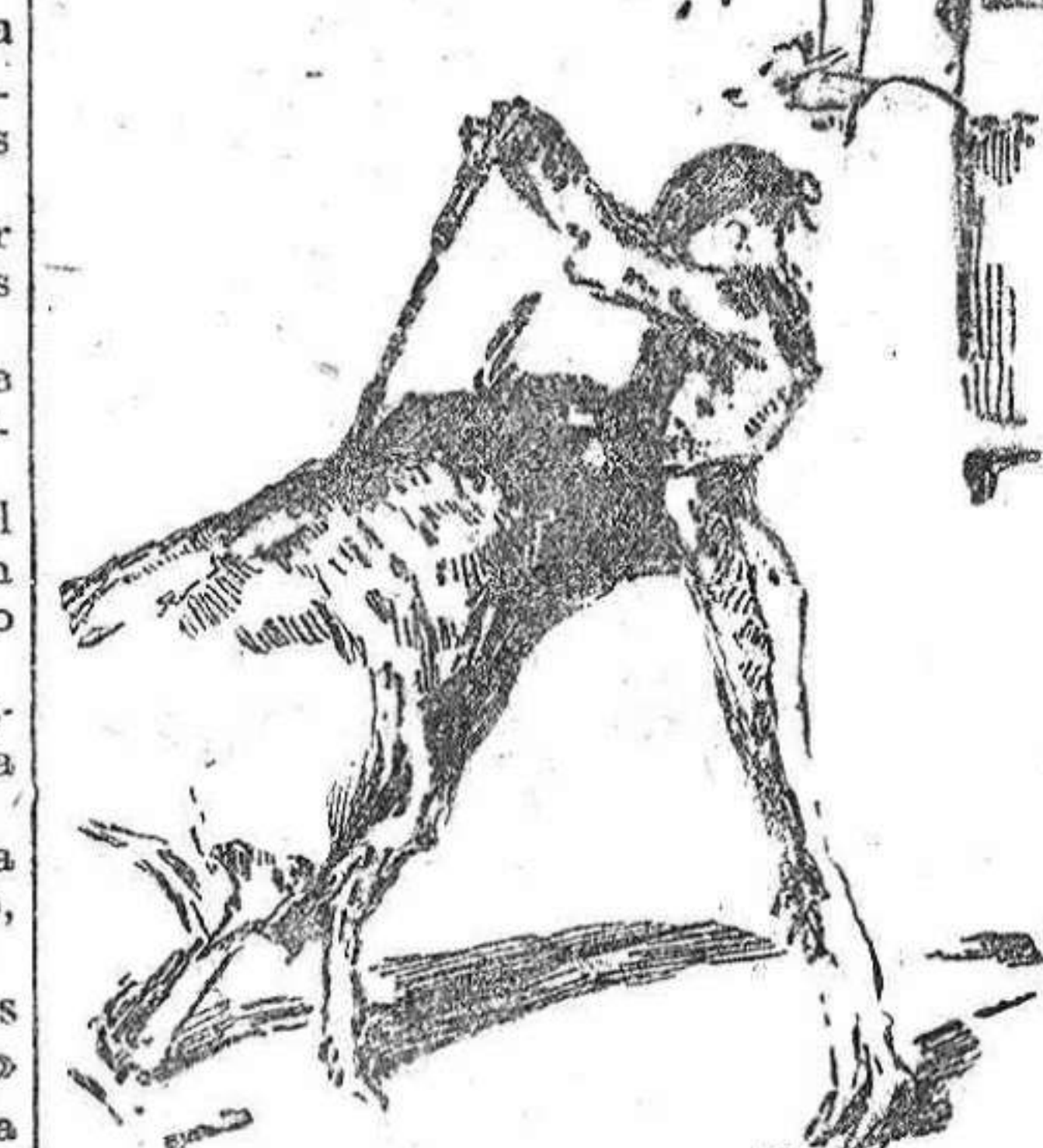
Un gran par de Mesita en el segundo toro de la tarde.

Así se encuentra al morisco Gavira, el de Cartagena, que reduce su trabajo a un trasteo de defensa, pues el toro, aunque no es malo, conserva un poder que atorra.