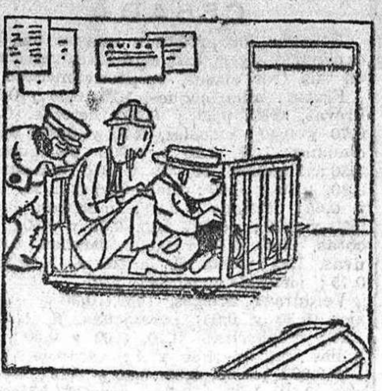
—Síntense, que yo lo llevaré a la quilla.