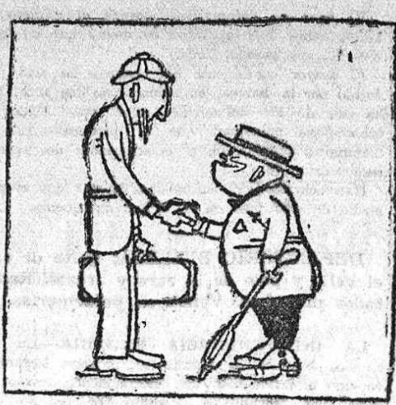
—Caranba, don Paco! ¡Tanto tiempo sin vernos!