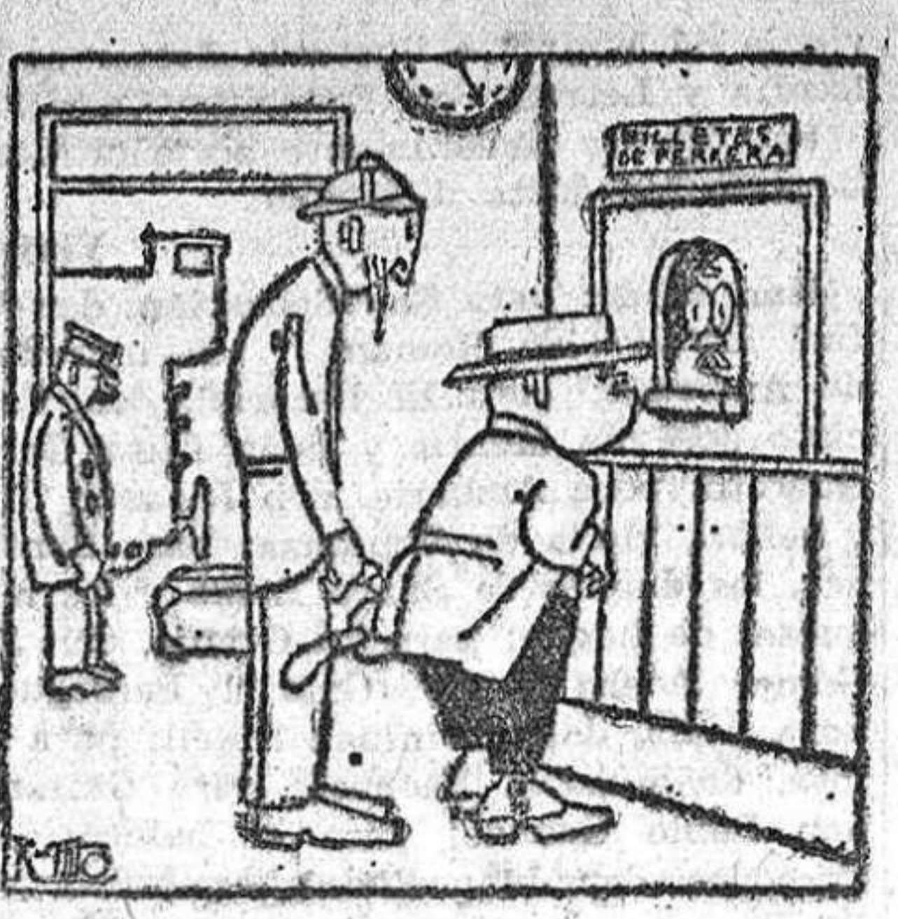
—¿Hace usted el favor? Dos billetes para el corto de Villaverde.