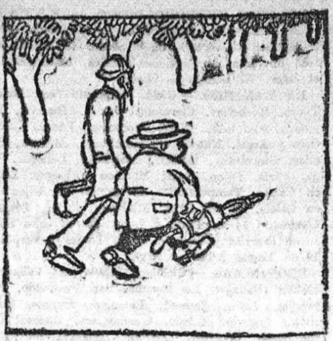
—Y yo con usted. No debo dejarle marchar solo.