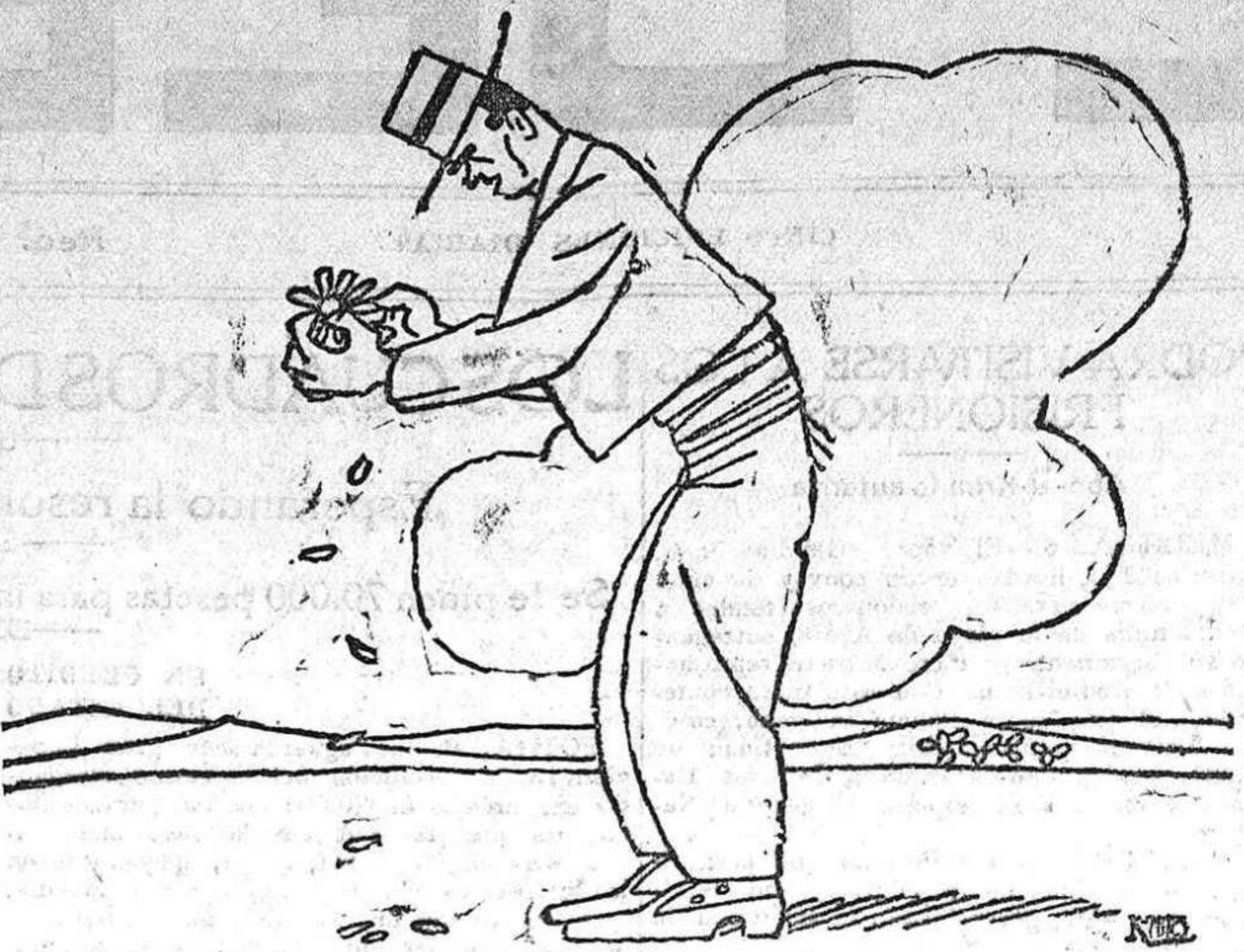
—¿Vamos a Alhucemas? ¿Sí? ¿No? ¿Sí? ¿No?