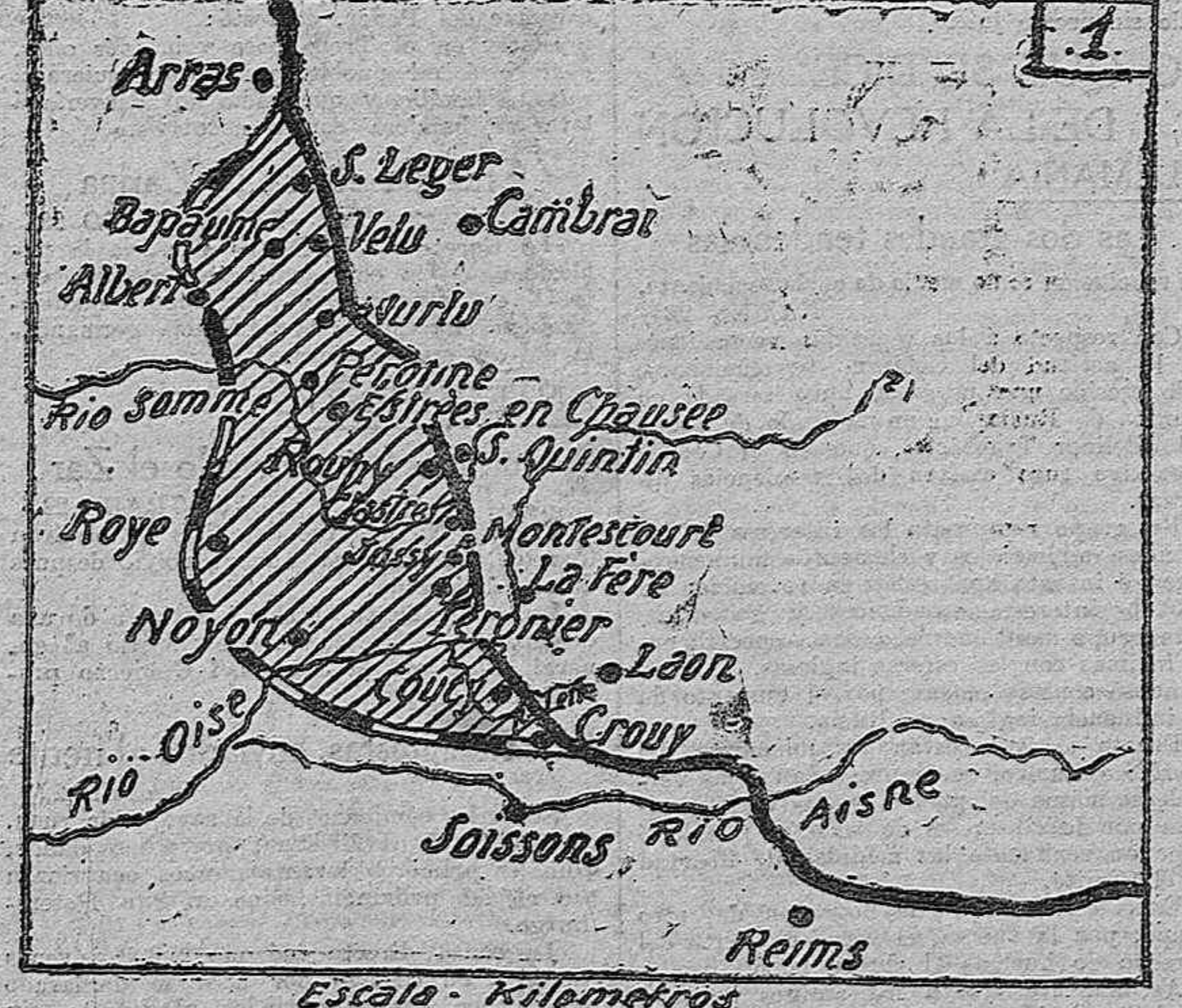
Posicion que ocupaban los franco-ingleses en 1º Julio de 1916. Posicion actual. Zona reconquistada por los franco-ingleses.

podemos expresar el deseo de que, aun en la realización de las reivindicaciones más legítimas, la salvación de la patria sea la ley suprema.