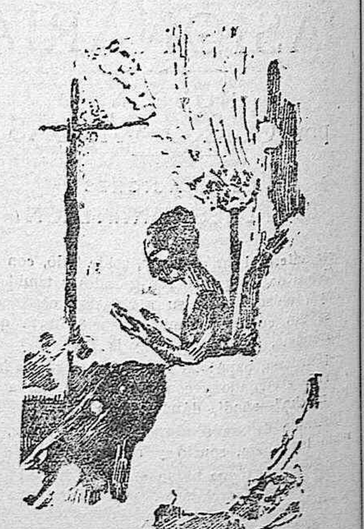
La contrasta muestra en elegante y elegante...