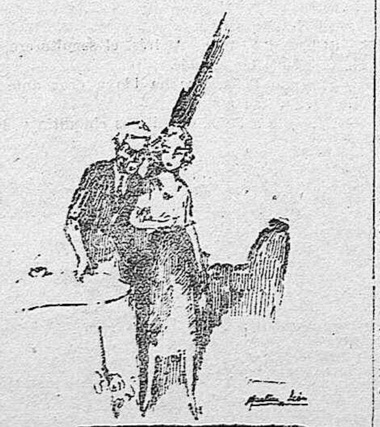
...se apoyó en mi brazo, como de costumbre, y salimos del comedor.

yo tenía, indudablemente, era el pelo, es decir, no el pelo, sino su color, casti rojizo. Sin embargo, recordaos, para consolarme, lo más feo que