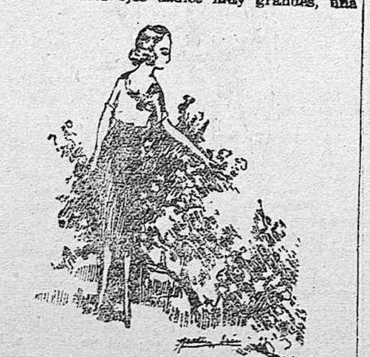
...pero era demasiado delgada y mis facciones...