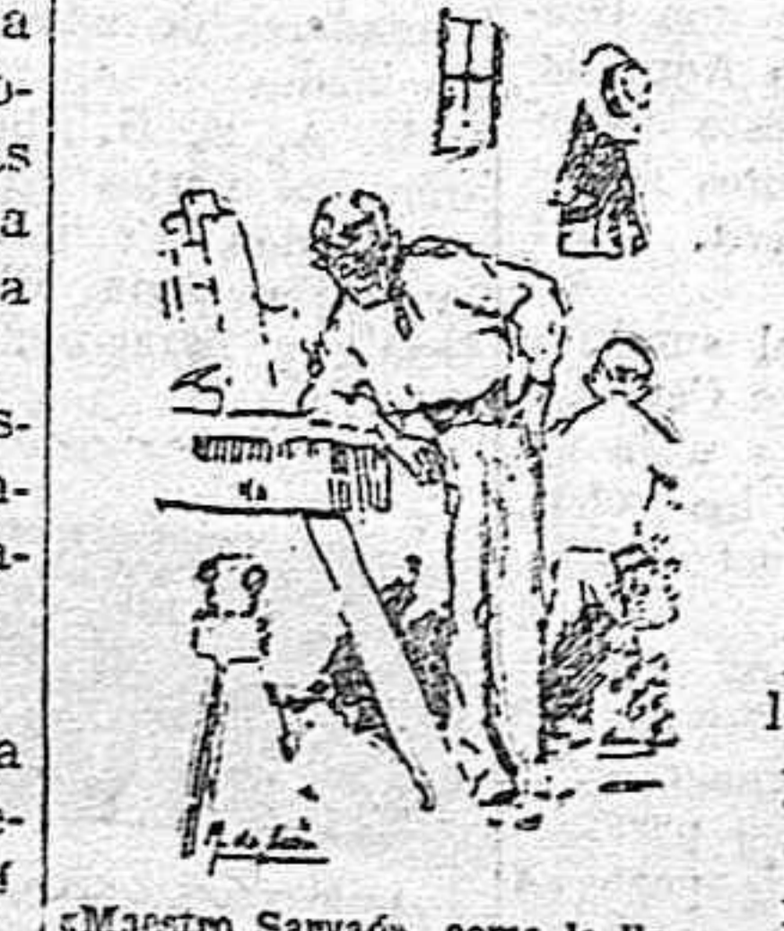
«Maestro Sarvaño», como le llamaban en Sevilla todos...