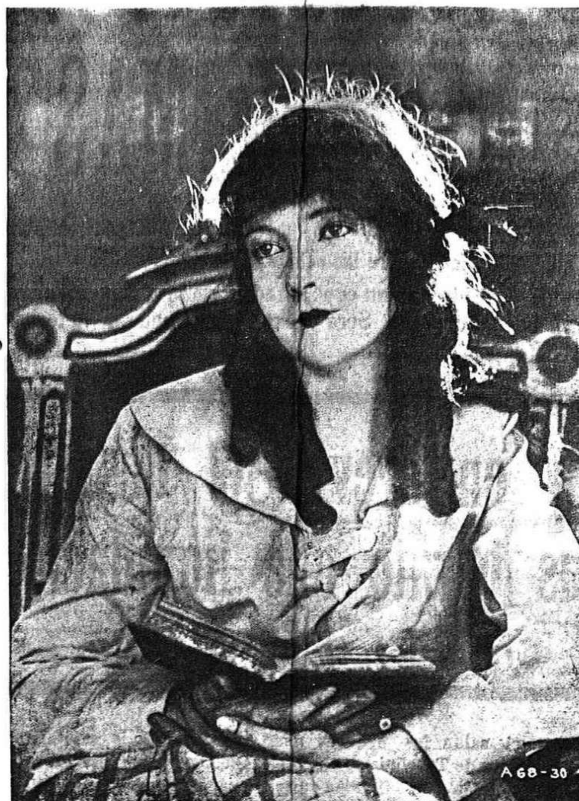
Una de las principales protagonistas de Lo más grande en la vida, sensacional película que se proyectará mañana en el Teatro Circo.

Nos alegramos.—Se encuentra enfermo nuestro estimado amigo el ex concejal del Ayuntamiento vitoriano y presidente de la So-