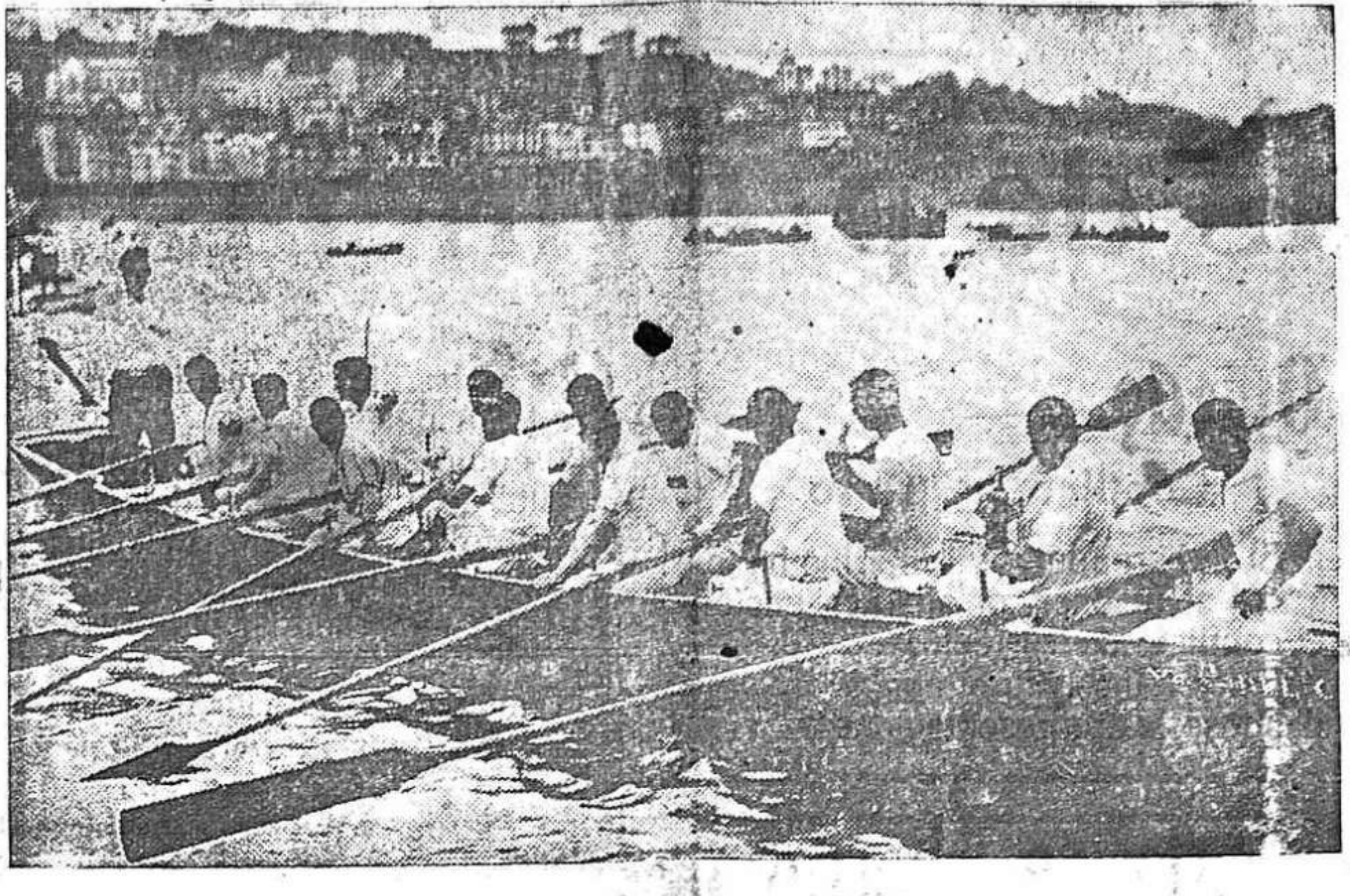
La tripulación de "Quirico" que el domingo 12 ganó la regata de Honor en San Sebastián, en 17 minutos, 45 segundos y tres quintos :-: