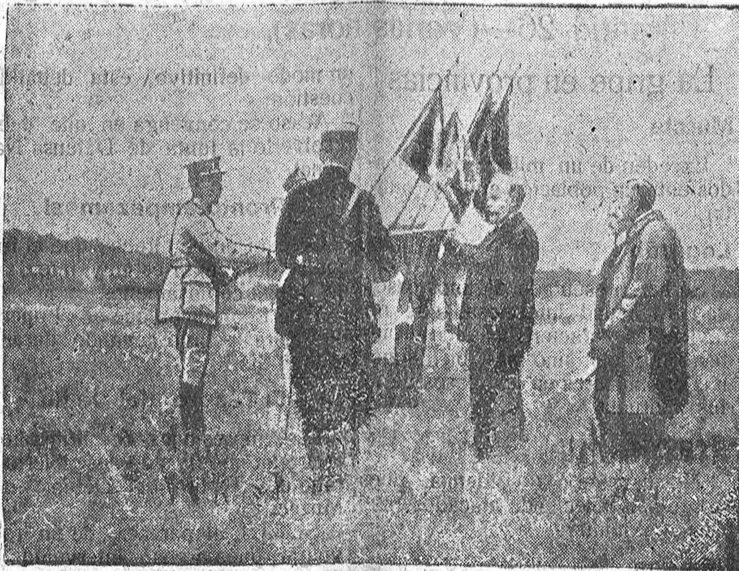
Mr. Poincaré colocando la Cruz de Guerra á una bandera