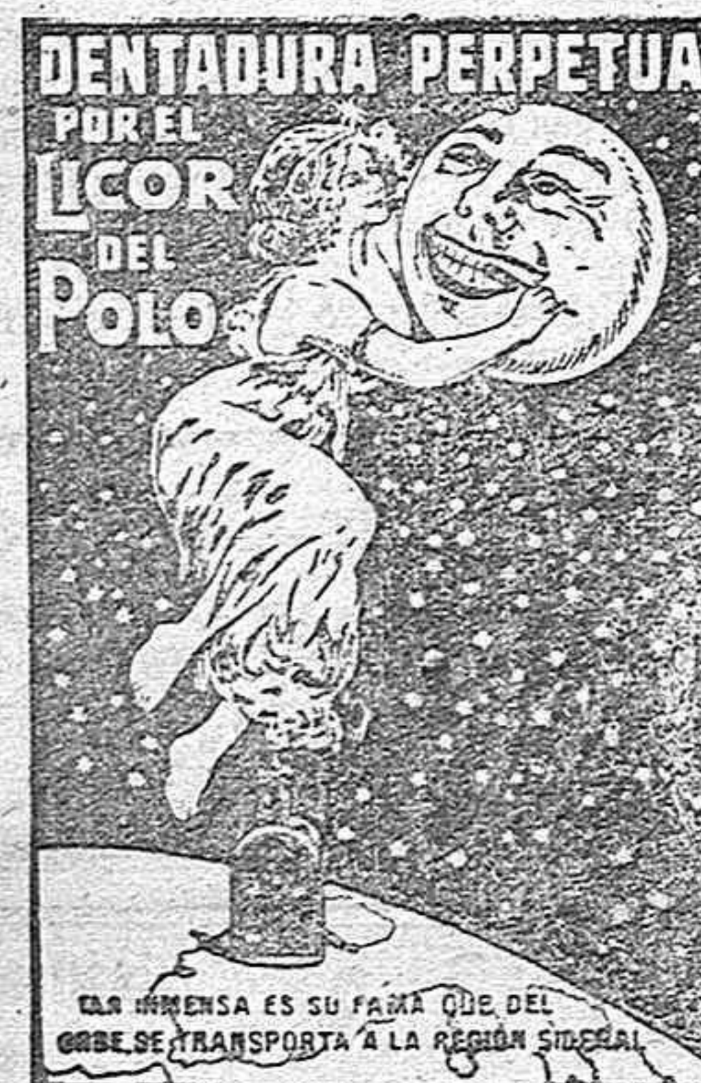
LA HIGIENIA ES SU FINE QUE DEL OMBRE SE TRANSPORTA A LA REGIÓN SINGRA

El mejor de todos los jabones por los componentes de su fabricación y su esmerada elaboración. El más económico, no solo por ser el que más dura, sino porque no estropea ni quema objetos lavados con él. Pedido en todas partes, exigiendo la marca estampada en cada trozo. Trazos de 500 y 250 gramos respectivamente.