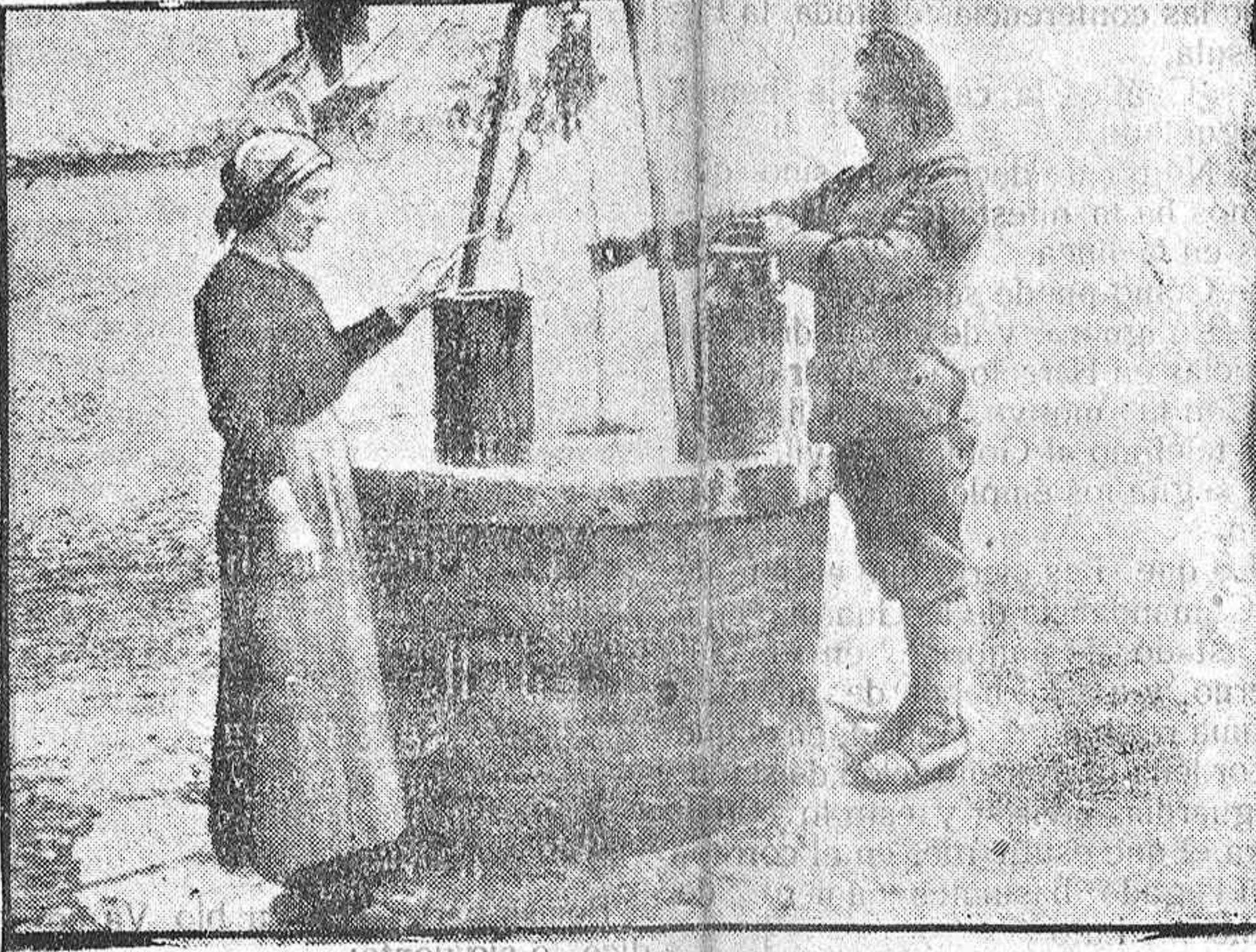
CAZADOR FRANCÉS Y ALDEANA EN UN PUEBLO ITALIANO