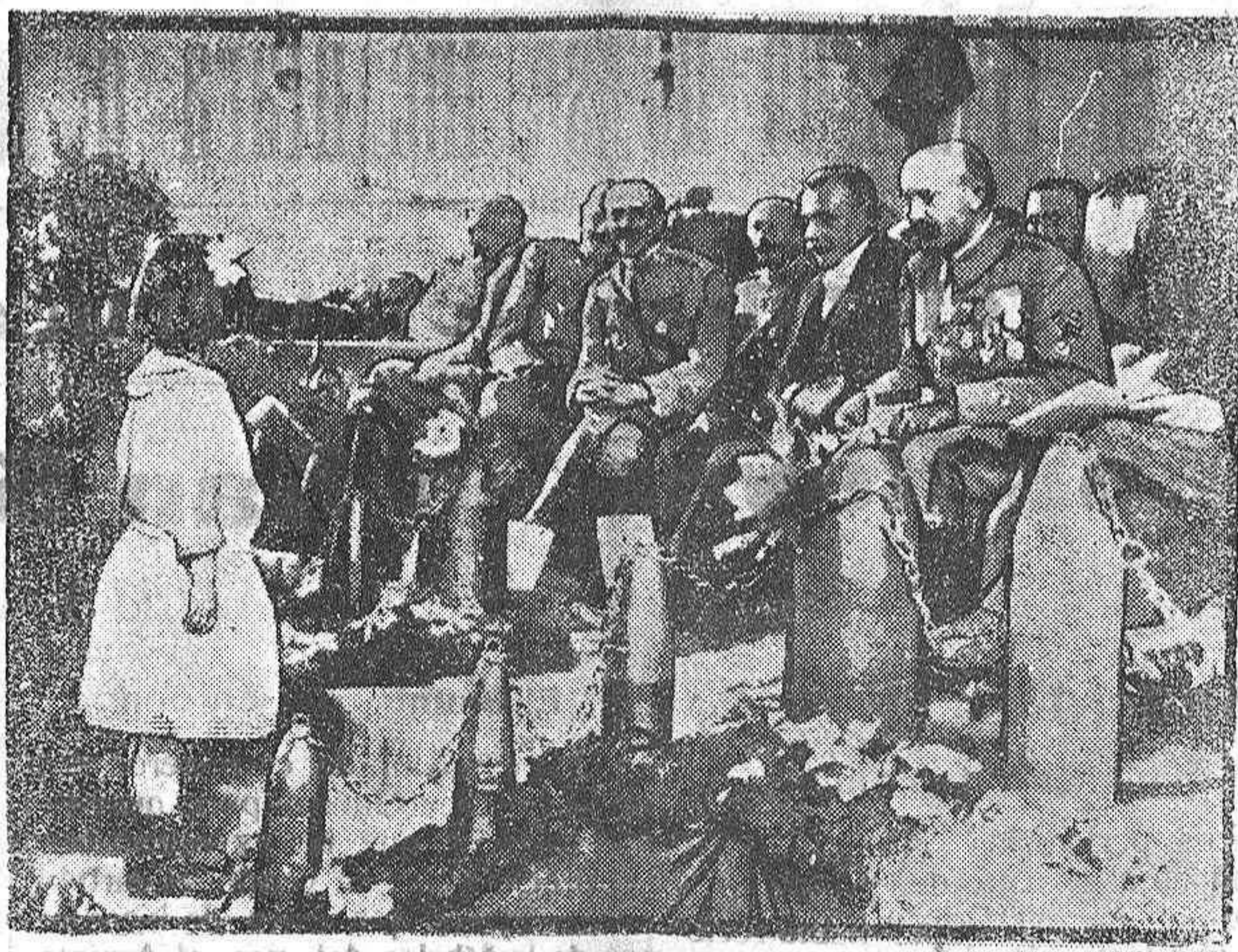
DISTRIBUCION DE PREMIOS EN ALSACIA