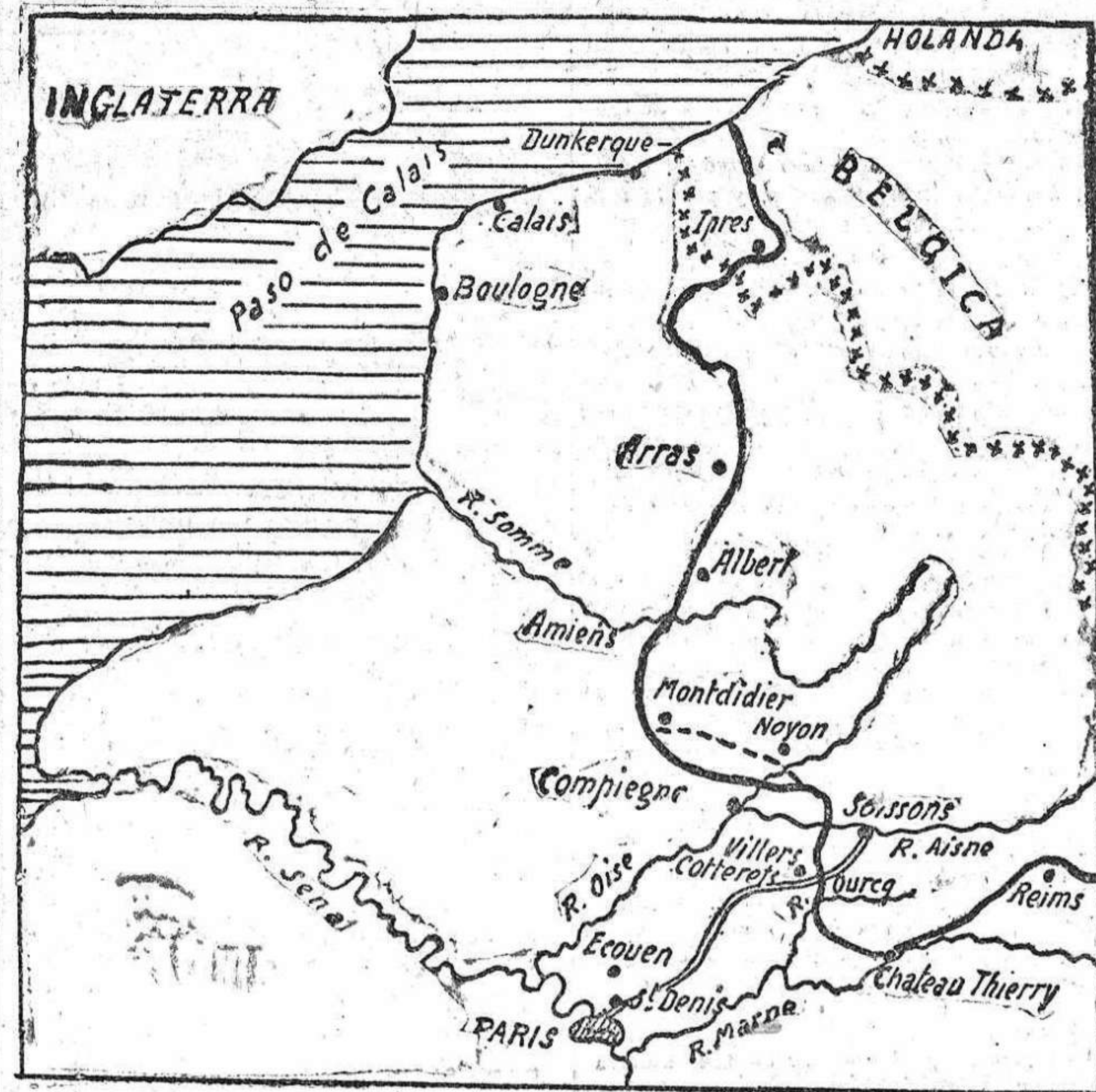
Posicion el 29 de Junio