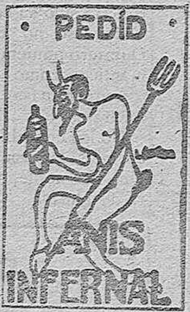
De venta en Cafés y principales comercios de Ultramarinos.

La revista «Garellanc» ha publicado una hoja extraordinaria con información local de Madrid y de provincias.