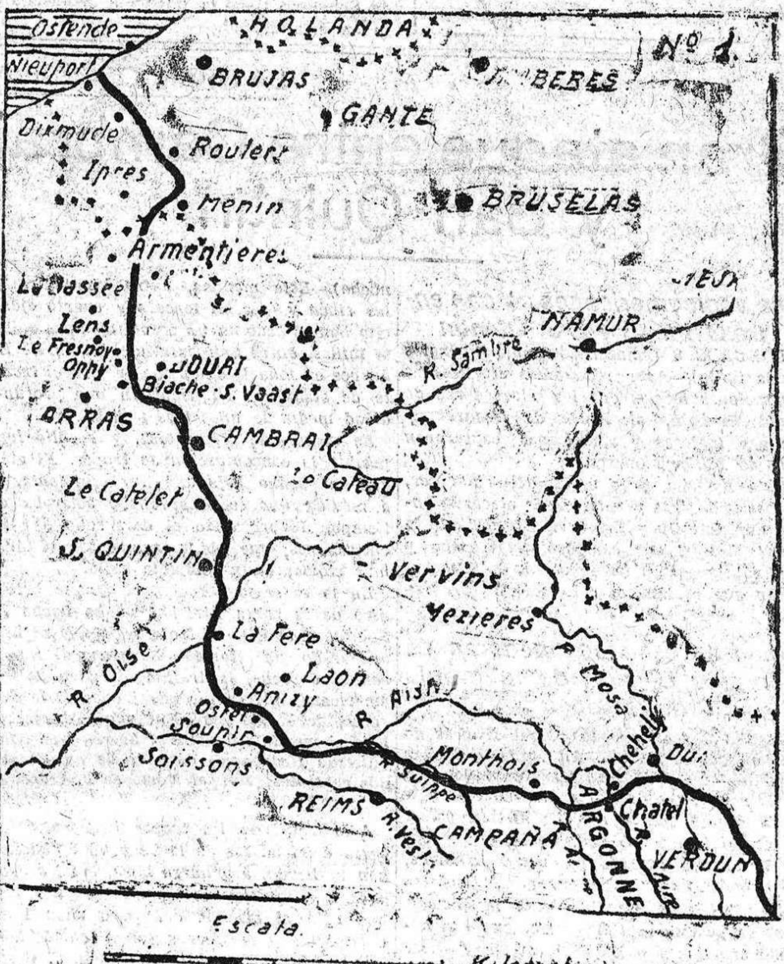
No me lea. Ver el croquis 1. ¿El de ayer? El mismo. El comentario consistente lo hará el lector. ¿Quiere conocer con más detalles lo que ha ocurrido en Occidente? Siga leyendo. En Flines, en el sector de Lila y en el de Cambrai, no ha ocurrido nada digno de mención; en el de Douai (croquis 1 y 4), los ingleses, que se habían apoderado de Lo Fresnoy tomaron Oppy y Blache Saint-Waast. Cerca de estos puntos estaban hace días.

Junto al Ailette y Norte del Aisne, tampoco lograron acercarse á la posición que ocupaban en Mayo... Y vamos al último sector, el comprendido entre Reims y Ver-