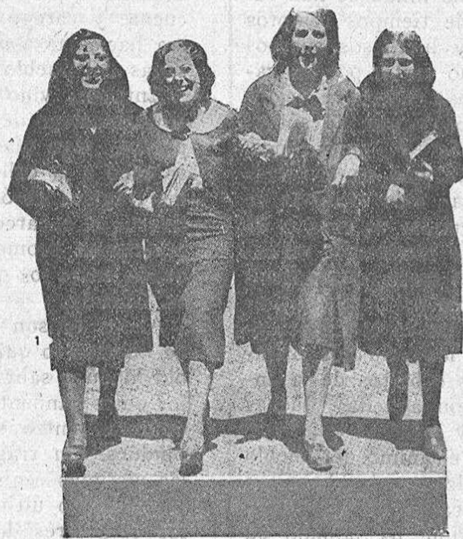
Las señoritas estudiantas

Esas muchachas que ahora empiezan a llenar Institutos, Universidades y Facultades, alternando con los muchachos, en cuya terna au-