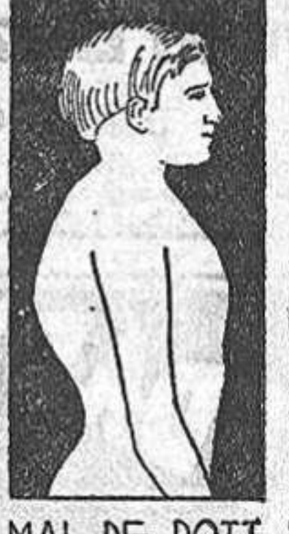
MAL DE POTT