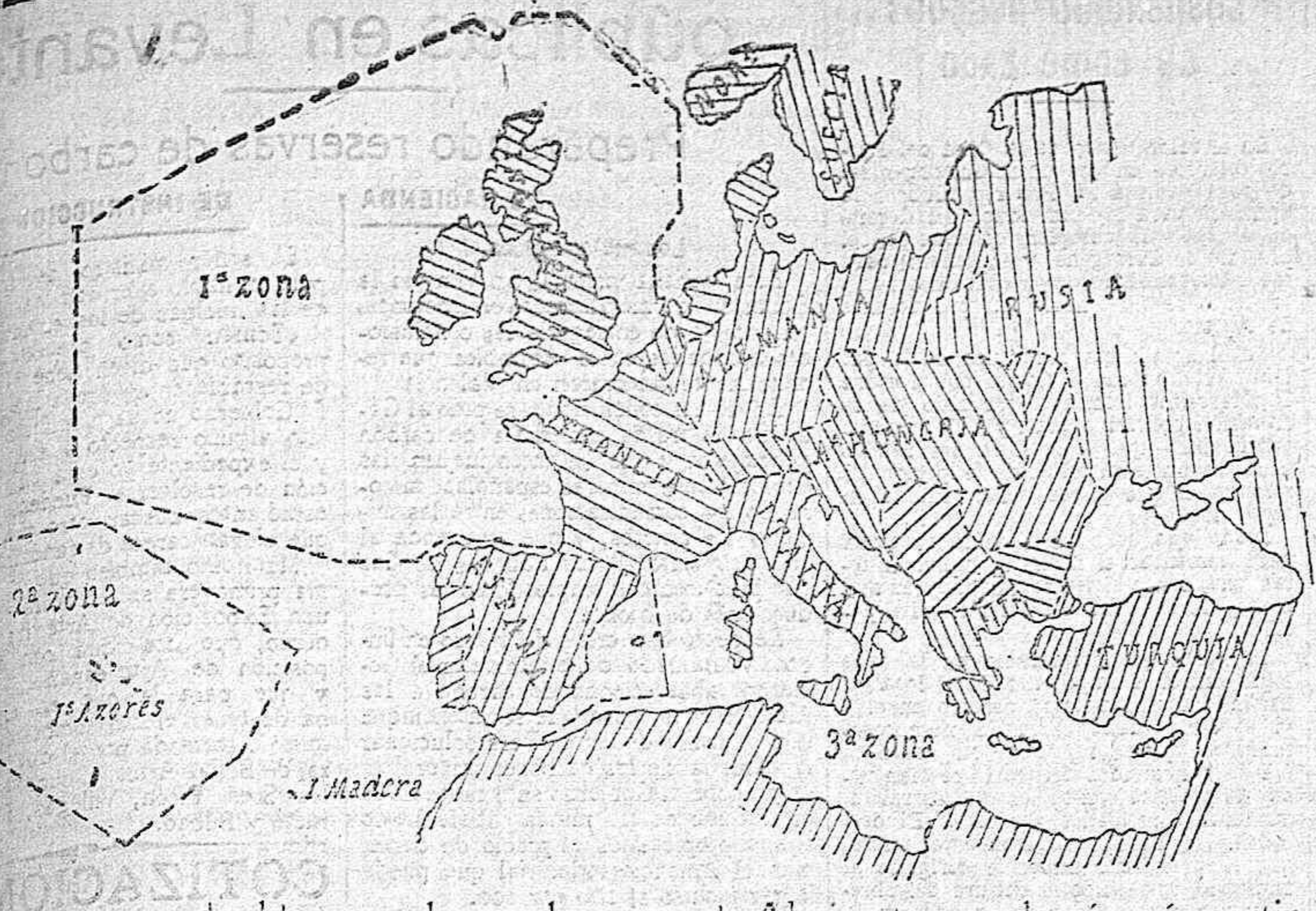
Las zonas de bloqueo de retadas por el Almirantazgo alemán, á partir del 22 de Noviembre