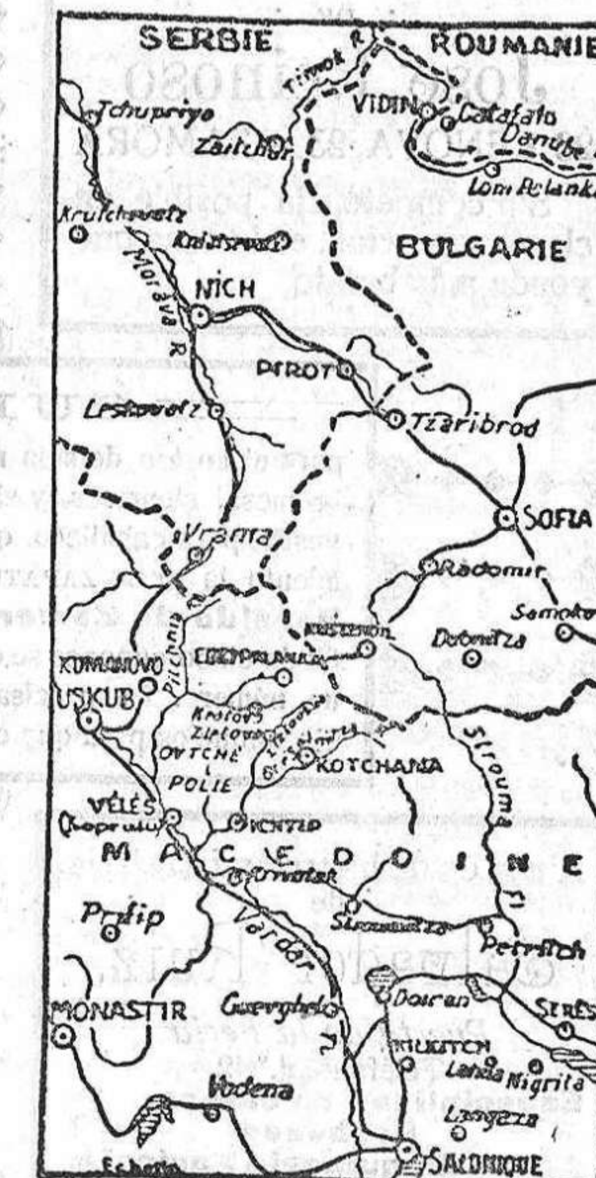
Gráfico de los lugares de la guerra.