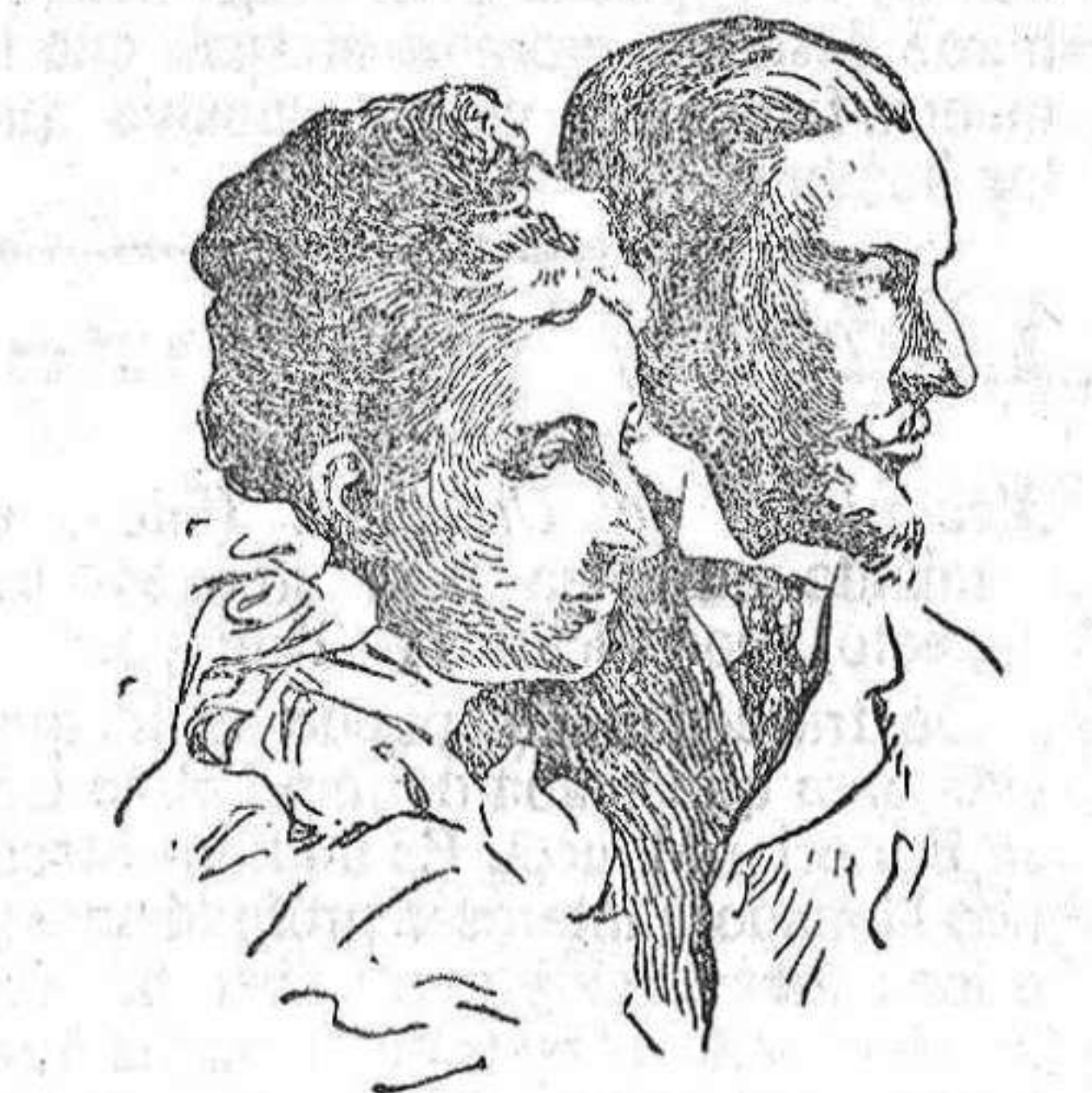
Los duques de Orleans.