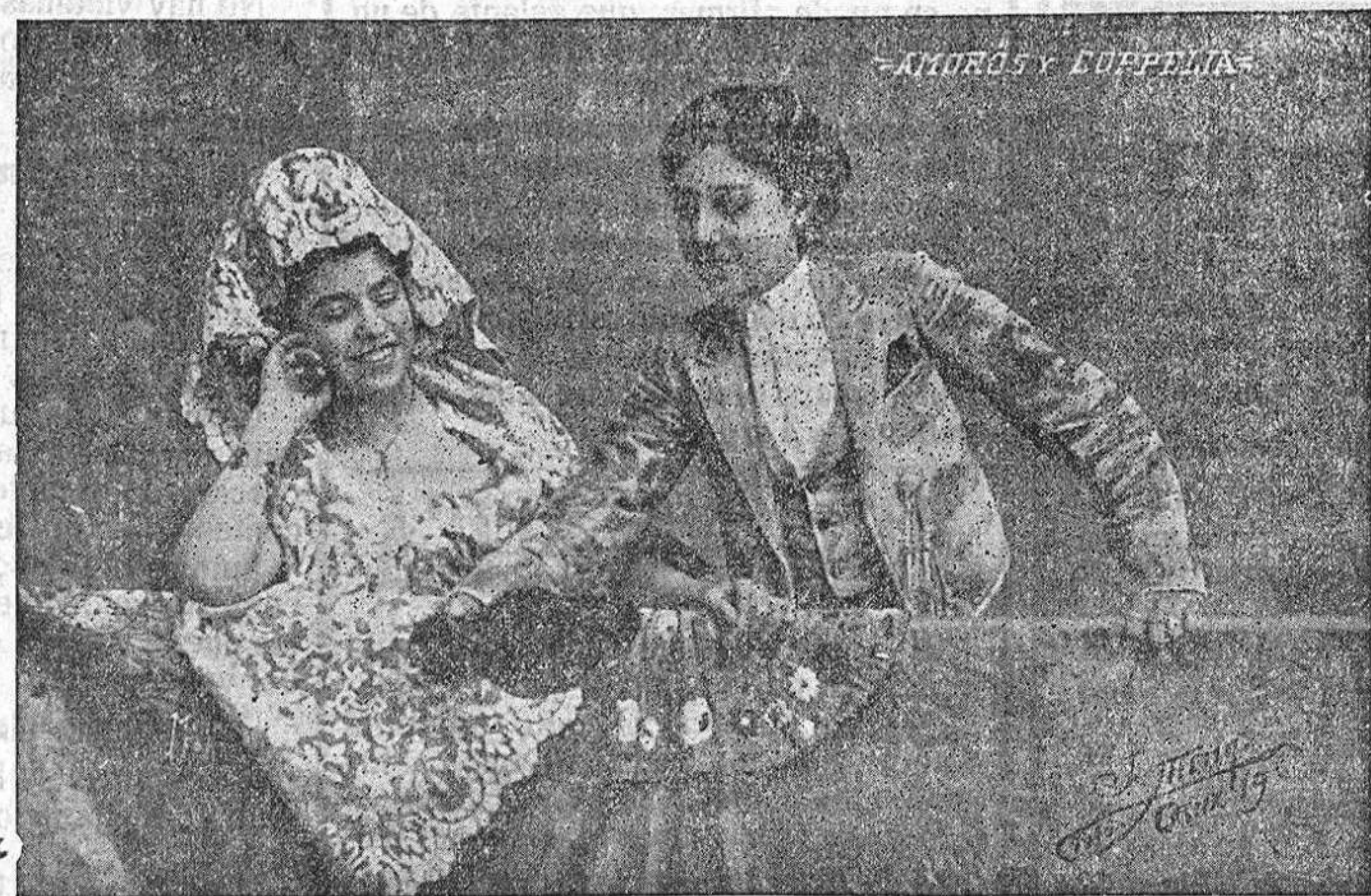
AMOROS y COPPELIA, celebradas bailarinas duetistas que anoche debutaron con extraordinario éxito en el Pabellón Buenaventura.