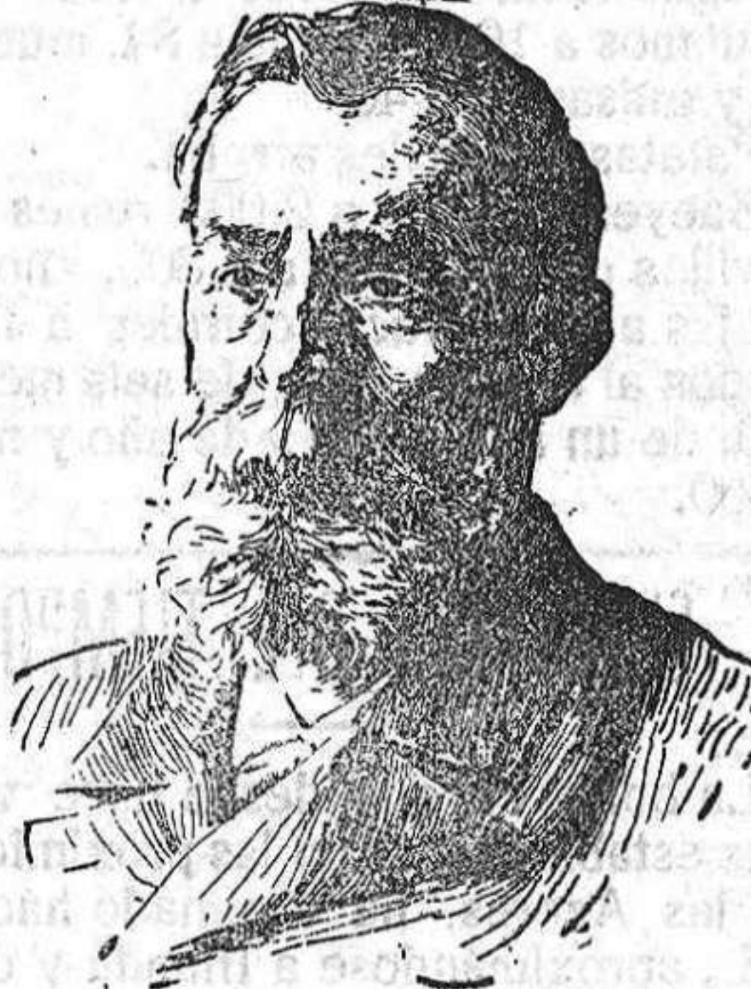
El maestro Bretón.

Los aplausos y las llamadas á escena, repetidas con delirante entusiasmo en todos los actos, unidas al fervor con que fué escuchada toda la partitura, no dejan lugar á dudas respecto al éxito de Tabaré . La crítica emitirá acerca de ella juicios más ó menos favorables, según sus gustos y las tendencias musicales.