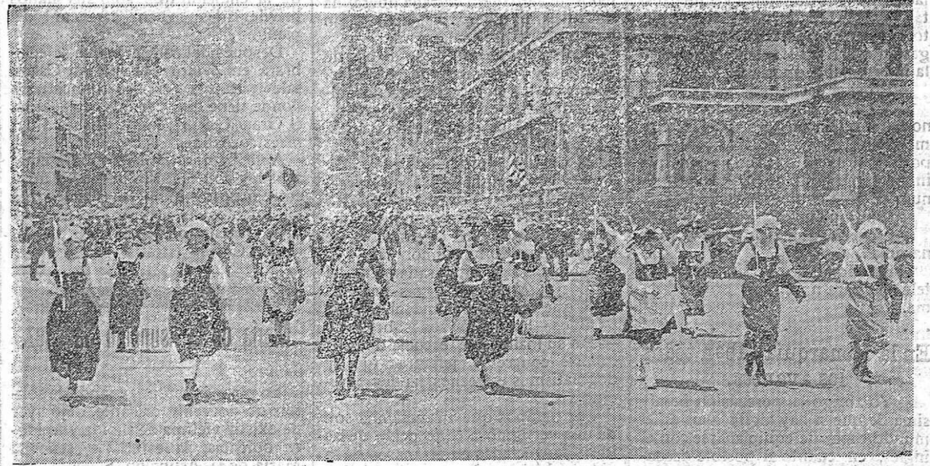
DE LA GUERRA.—Ciudadanos de origen extranjero en una fiesta patriótica desfilando ataviados con sus trajes nacionales por Fifth Avenue, Nueva York.

Confieso mi pecado, las novelas, cuentos y películas de policías y ladrones me encantan y entretienen sobre todas las cosas. Aquellas apariciones fantásticas por puertas secretas y misteriosas; aquellos trozos interesantes, que emocionan al espíritu más flemático; aquellos derroches de ingenio y habilidad desarrollados lo mismo en los ladrones audaces que en los policías talentados; en fin, aquellas maravillosas creaciones de Conan D'Osyle y Hornung, Sherlock Holmes y Rafles, nos entu-