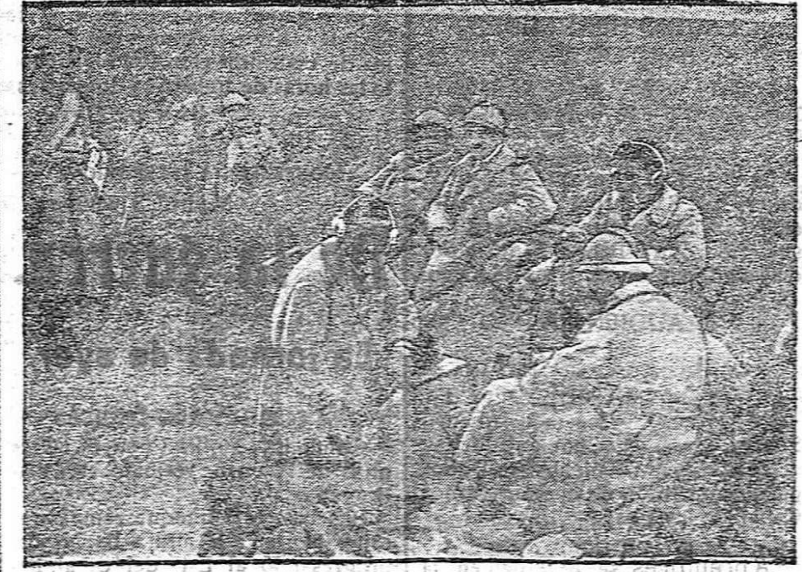
DE LA GUERRA.—Puesto de mando francés durante un combate.

Causas, a nadie licitamente atribuibles, han hecho que esta Sección