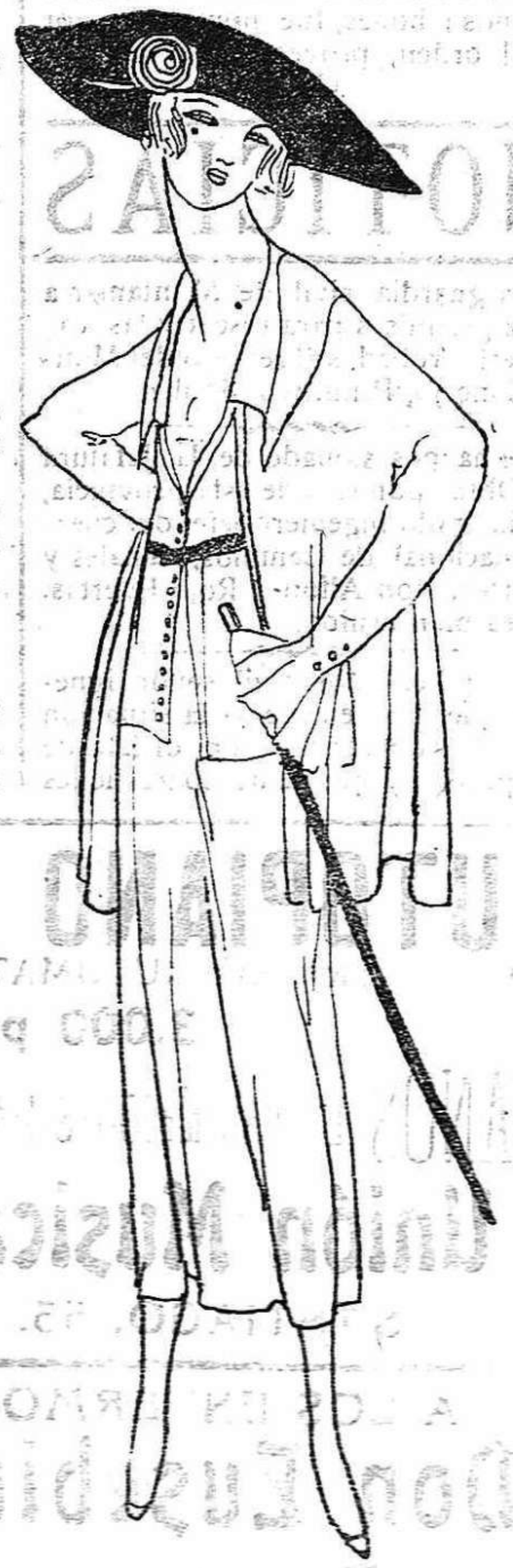
Dibujo de José Zamora. Traje de lanilla blanca para paseo. sillería ya pasada de moda, por ejemplo, de esas que se arrinconan en las

Sin necesidad de recurrir a los tapiceros inabundables que, como Martínez, piden sesenta mil francos por instalar un cuarto de baño—naturalmente tan excesivamente lujoso como si fuese moda recibir dentro de una piscina, a la luz de las lámparas de cristal veneciano—sin necesidad de verse en el horrible trance de no pagar la cuenta y apelar a subterfugios de indio sioux para no ver a los acreedores, una persona de buen gusto y de escasos medios de fortuna puede instalar su hogar de un modo confortable y refinado. Una