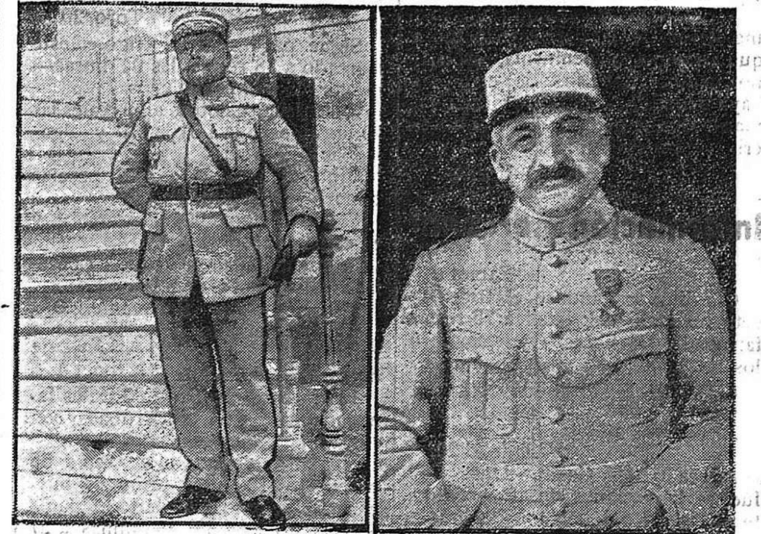
El general Guillaumet.

Por 12 votos contra cinco fué desechada la proposición del señor Sendín, pidiendo que el exrecaudador señor Laguna haga entrega de los valores al depositario municipal, según determina la ley y que no se le