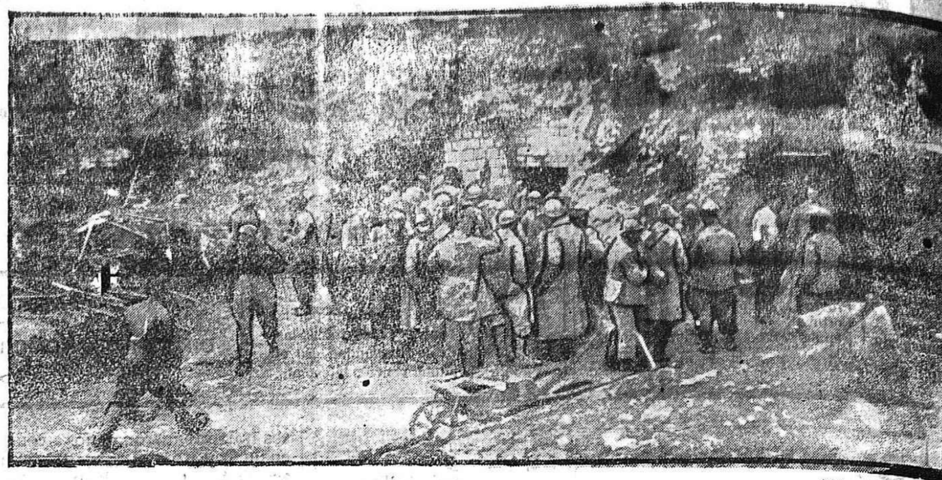
DE LA GUERRA.—Antiguo abrigo alemán conquistado por los franceses.

Era necesario que en esta ciudad, se estableciese una especie de Ateneo y de que Zamora despertase del letargo en que parecía hallarse su vida, respecto a la mayor difusión de la enseñanza y de pronto, cuando no se creía, surge tan noble idea de las ilustradísimas profesoras que tan